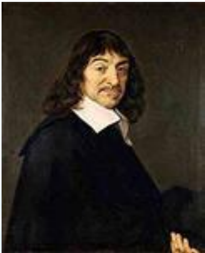
Великий французский математик Рене Декарт