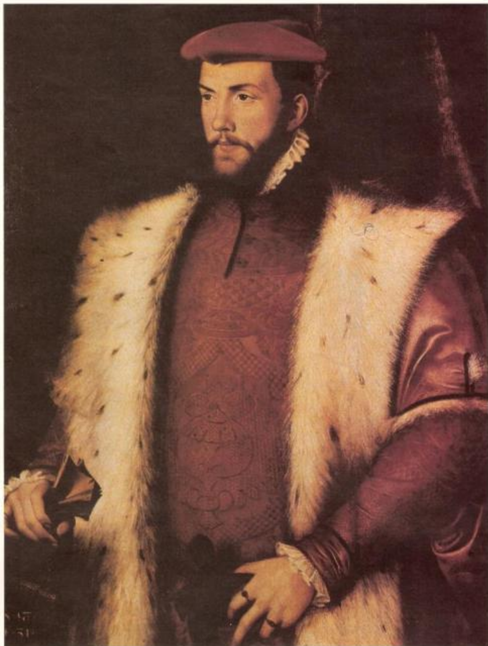
Ф. Кривелли. Портрет кардинала Диего Колонны. XVI век. Шанхай. Музей Конце.