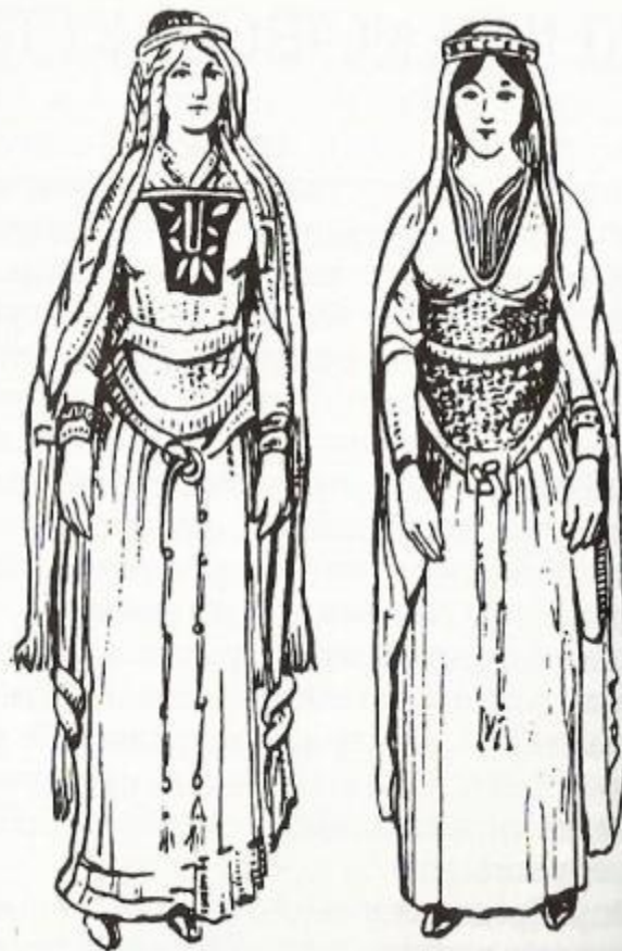
Женские платья, накидки, украшения, причёски. Середина XII в.