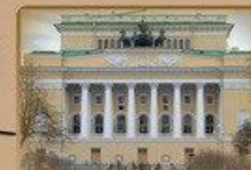
Александринский Театр Пл. Островского 1 1500 метров