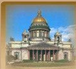
Исаакиевский Собор Исаакиевская пл. 1 300 метров