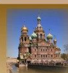
Храм Спас-на-Крови Кан. Грибоедова 2А 1150 метров