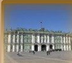
Эрмитаж (Зимний Дворец) Дворцовая наб. 1 500 метров