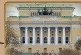
Александринский Театр Пл. Островского 1 1500 метров