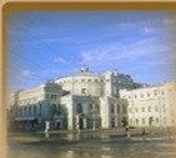
Маринский Театр Театральная пл. 1 1300 метров