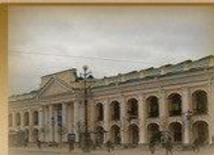
Гостинный Двор Невский пр. 35 1000 метров