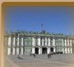
Эрмитаж (Зимний Дворец) Дворцовая наб. 1 500 метров