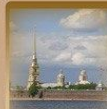
Петропавловская Крепость Заячий Остров 1500 метров