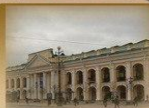
Гостинный Двор Невский пр. 35 1000 метров