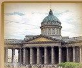
Казанский Собор Казанская пл. 2 700 метров