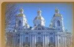
Никольский Собор Никольская пл. 1/3 1500 метров