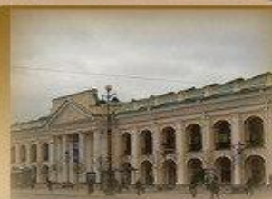
Гостинный Двор Невский пр. 35 1000 метров