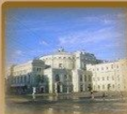
Маринский Театр Театральная пл. 1 1300 метров