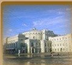
Маринский Театр Театральная пл. 1 1300 метров