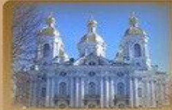
Никольский Собор Никольская пл. 1/3 1500 метров