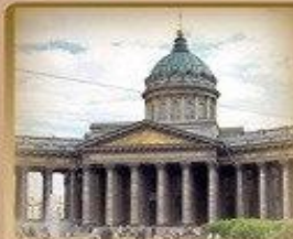
Казанский Собор Казанская пл. 2 700 метров