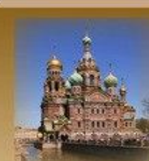
Храм Спас-на-Крови Кан. Грибоедова 2А 1150 метров