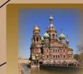
Храм Спас-на-Крови Кан. Грибоедова 2А 1150 метров