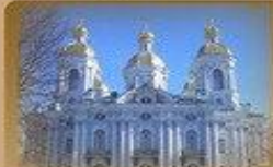
Никольский Собор Никольская пл. 1/3 1500 метров