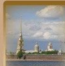
Петропавловская Крепость Заячий Остров 1500 метров