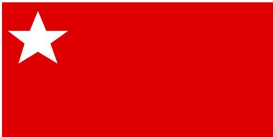
Символ Знамени Победы 2-я поправка