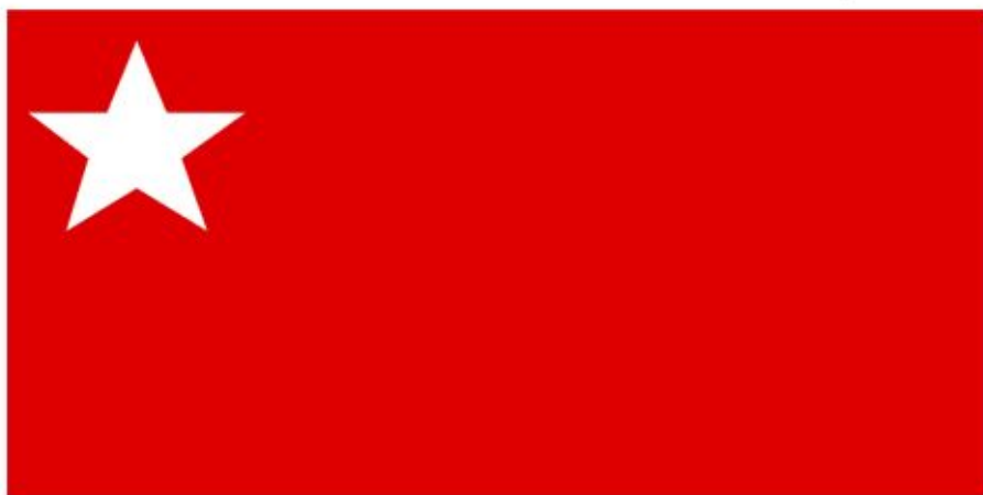
Символ Знамени Победы 2-я поправка