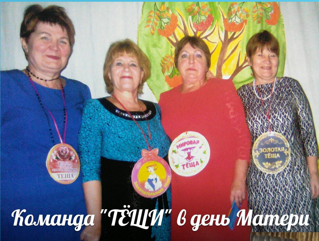
Команда "ТЁЩИ" в день Матери