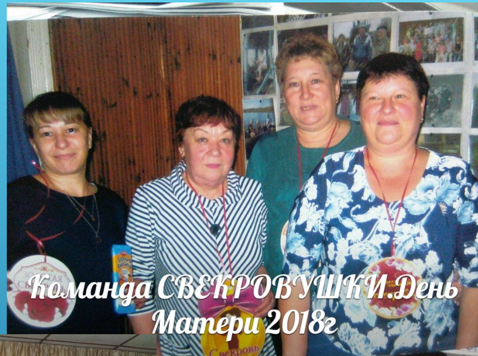
Команда СВЕКРОВАЯ ТЁЩА. День Матери 2018г