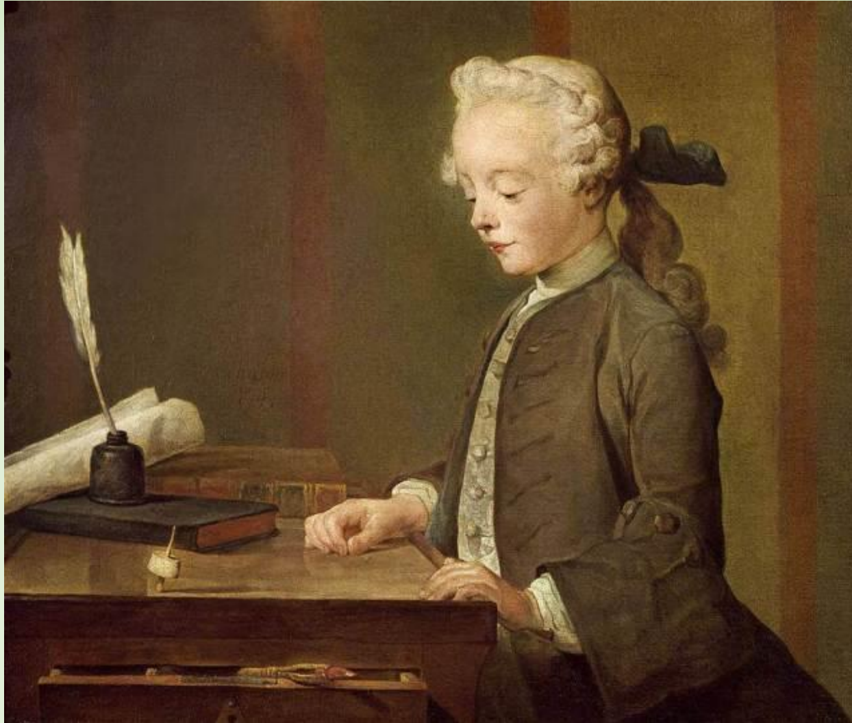
Ж-Б Шарден. Мальчик с юлой.

Меняется отношение к образованию. Под влиянием научной революции мир перестает восприниматься как опасный и непредсказуемый. Познавая его законы люди учатся его менять. Возникает идея, что точно также можно и нужно изменять человека. Появляется литература, посвященная воспитанию. Открываются учебные заведения.