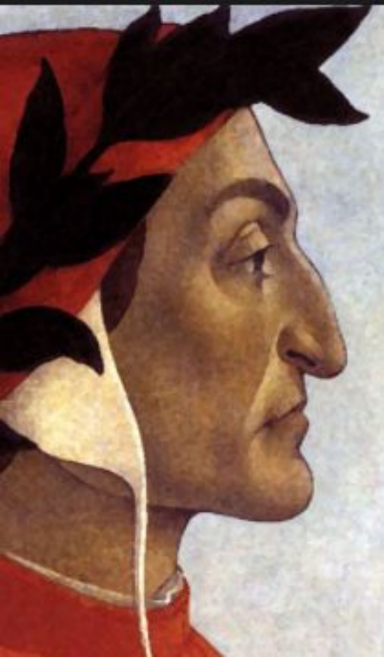
Данте Алигьери 1265 - 1321