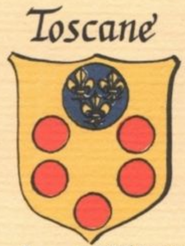
Laurent II (Médicis) "le Magnifique"