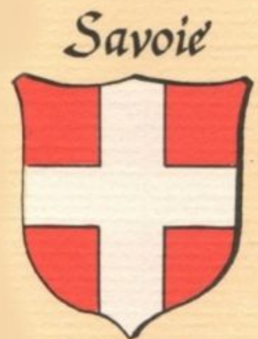
Charles II, Duc