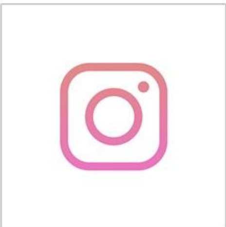
Продвижение артиста в Instagram