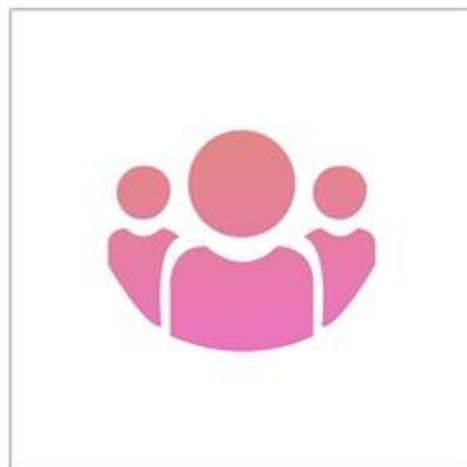
Ведение социальных сетей