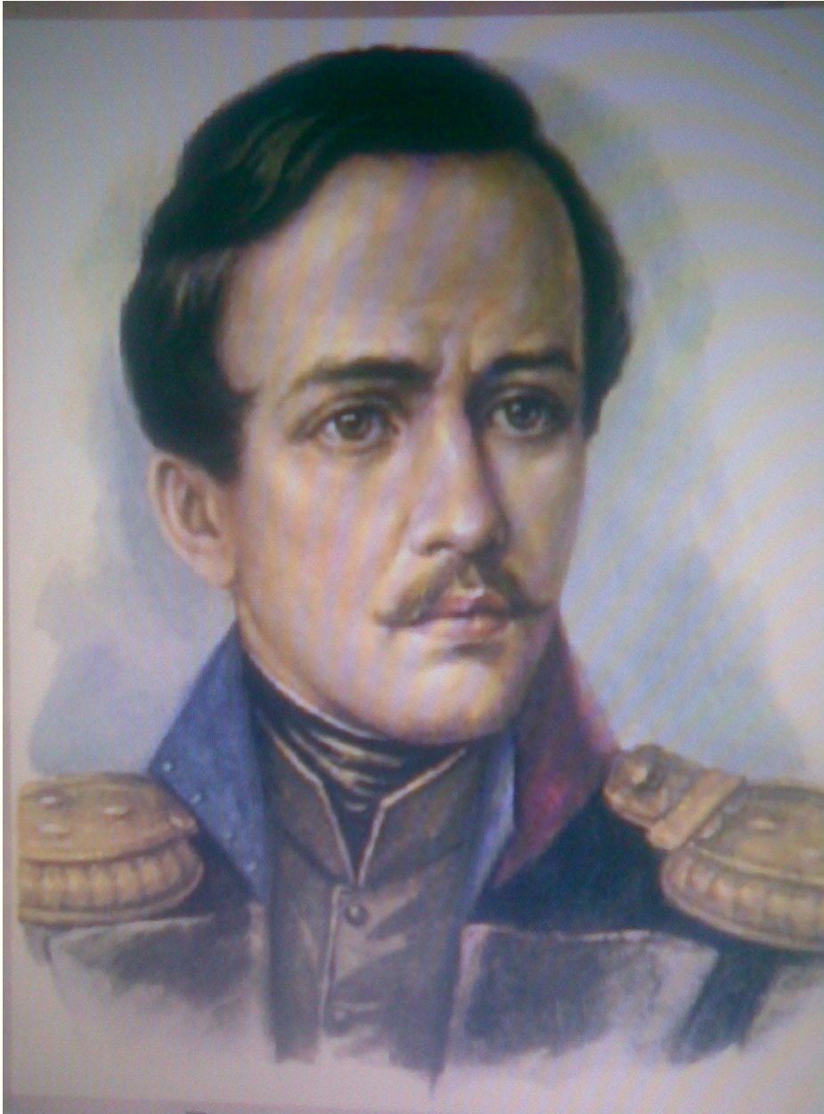
Михаил Юрьевич Лермонтов (1814-1841)