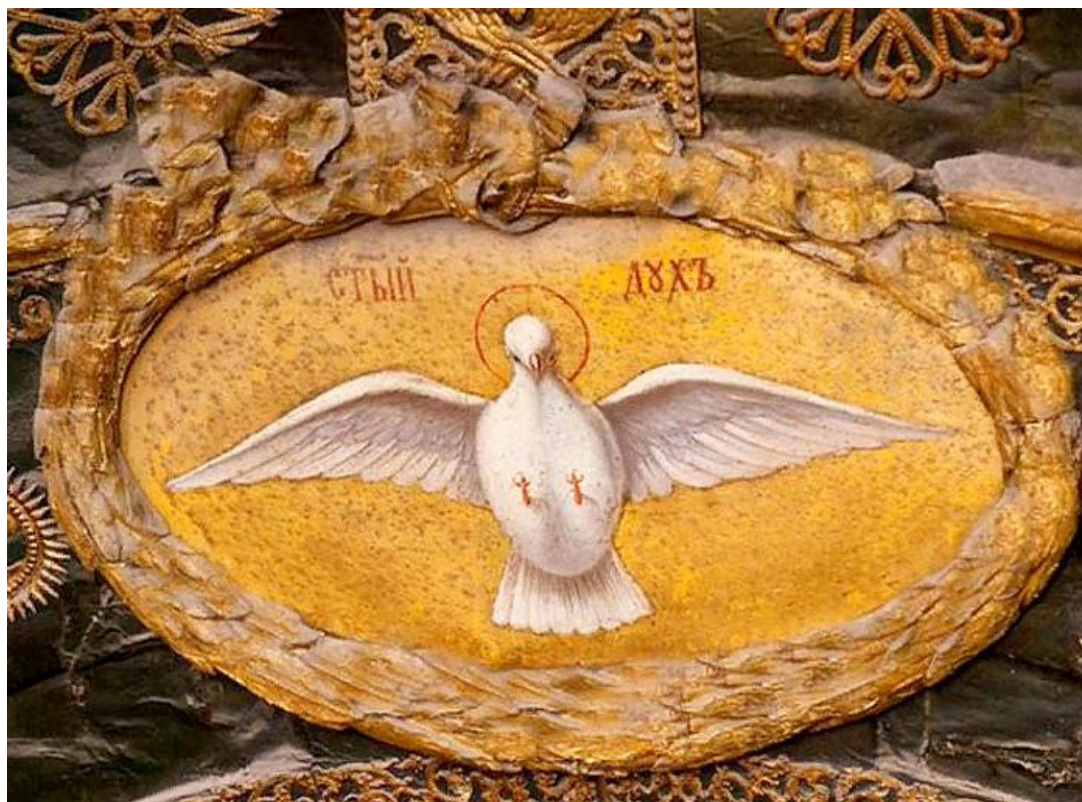
Икона «Святой Дух»

На следующий день после самого торжественного события празднуется "сугубая память" главного лица праздника. Так, День Святого Духа, который отмечают на следующий день после Троицы, посвящен Святому Духу. Потому что именно Он сходит на апостолов