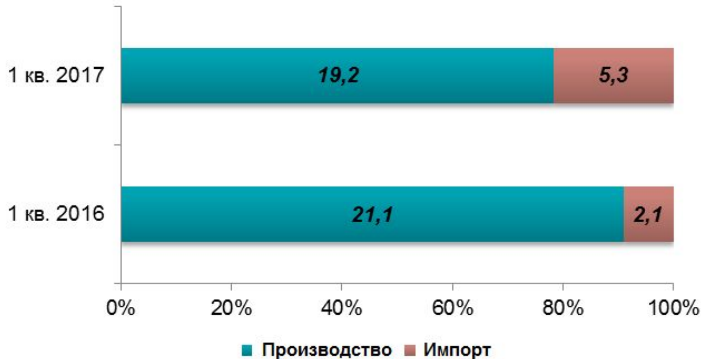
Структура ринку макарон по походженню продукції в 2016 –2017 гг., тис. тонн