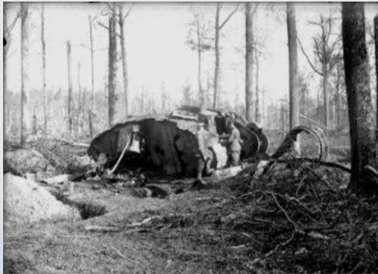
Битва при Камбре, 20 ноября 1917 г. Foto: A. Mg. 1111 November - October

Однако в результате стремительной атаки пехота отстала, а танки продвинулись далеко вперёд, понеся серьёзные потери. 30 ноября 2-я германская армия совершила внезапную контратаку, отбросив силы союзников на первоначальные рубежи. Несмотря на отражение атаки, танки доказали свою эффективность в бою, а сама битва положила начало широкому применению танков и развитию противотанковой обороны.