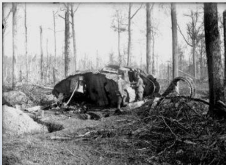
Битва при Камбре, 20 ноября 1917 г. 1111 November - October

Однако в результате стремительной атаки пехота отстала, а танки продвинулись далеко вперёд, понеся серьёзные потери. 30 ноября 2-я германская армия совершила внезапную контратаку, отбросив силы союзников на первоначальные рубежи. Несмотря на отражение атаки, танки доказали свою эффективность в бою, а сама битва положила начало широкому применению танков и развитию противотанковой обороны.