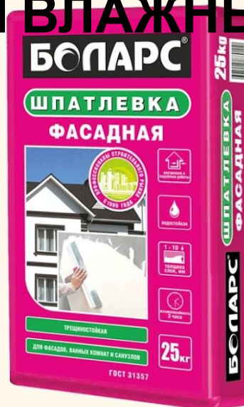
ФАСАДНАЯ (25 кг)