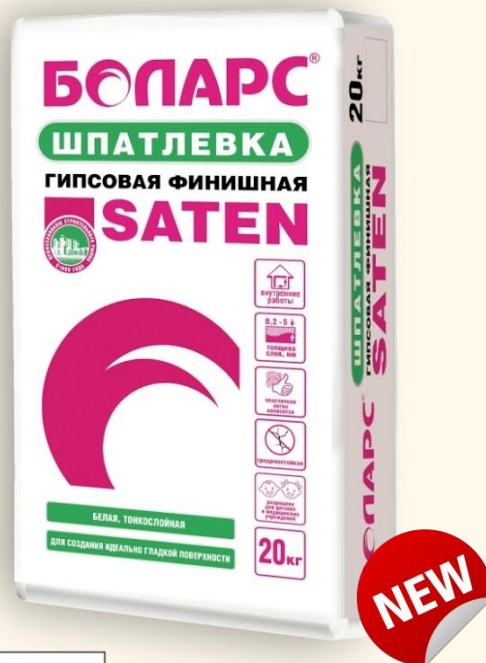
ФИНИШНАЯ SATEN (20 кг)