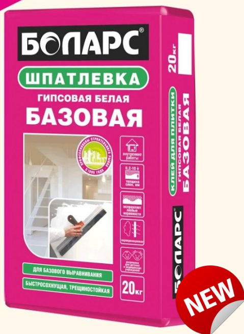
БАЗОВАЯ (20 кг)