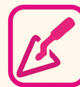
МОНТАЖН ЫЙ КЛЕЙ