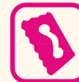
КЛЕЙ ДЛЯ УТЕПЛЕН ИЯ