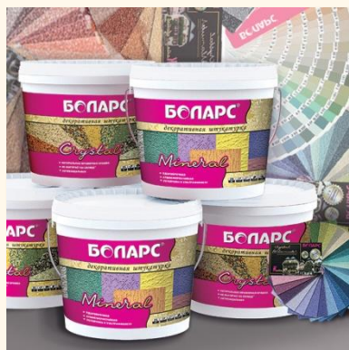
ДЕКОРАТИВН ЫЕ МАТЕРИАЛЫ