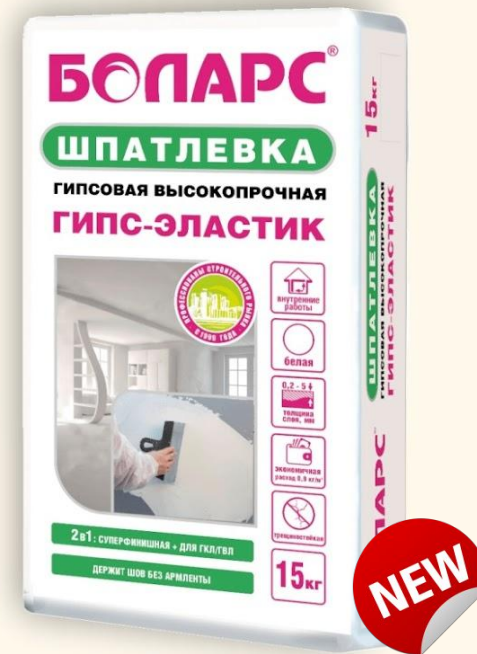
ГИПС-ЭЛАСТИК 2 в 1 (15 кг)