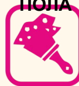
ДЕКОРАТИВН ЫЕ ШТУКАТУРКИ