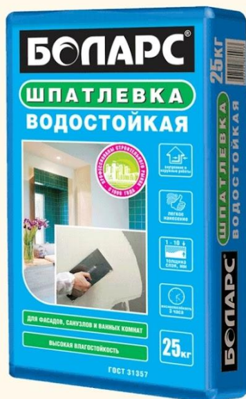
ВОДОСТОЙКАЯ (25 кг)