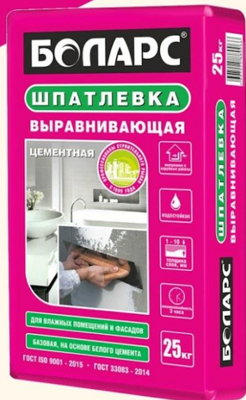
ВЫРАВНИВАЮЩАЯ (25 кг)