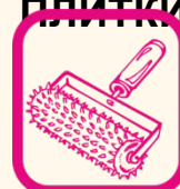
СМЕСИ ДЛЯ ПОЛА