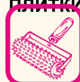
СМЕСИ ДЛЯ ПОЛА