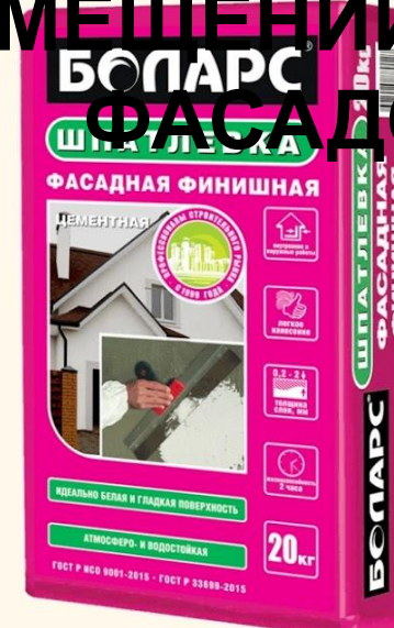
ФАСАДНАЯ ФИНИШНАЯ (20 кг)