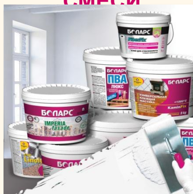
ГОТОВЫЕ КЛЕИ И ШАТТЕРКИ