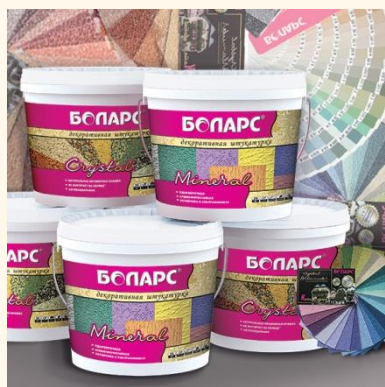
ДЕКОРАТИВН ЫЕ МАТЕРИАЛЫ