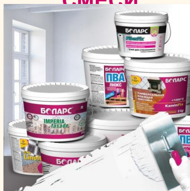
ГОТОВЫЕ КЛЕИ И ШАТЛЕРКИ