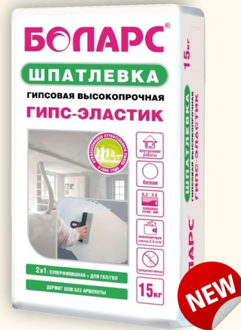
ГИПС-ЭЛАСТИК 2 в 1 (15 кг)