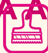
ПЛИТОЧН ЫЙ ПЛИТКИ