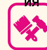
ВСПОМОГАТЕЛЬ НЫЕ МАТЕРИАЛЫ