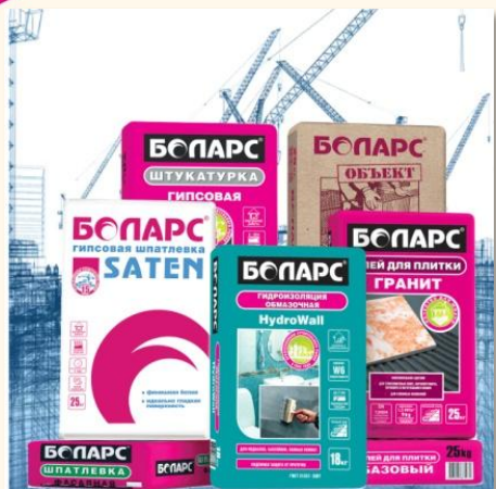
СУХИЕ СТРОИТЕЛЬН ЫЕ СМЕСИ