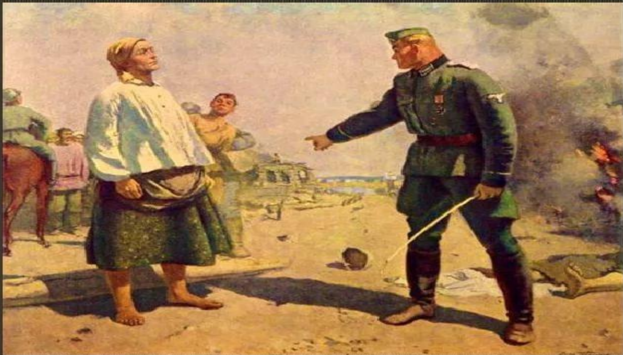
С. Герасимов «Мать партизана» 1943