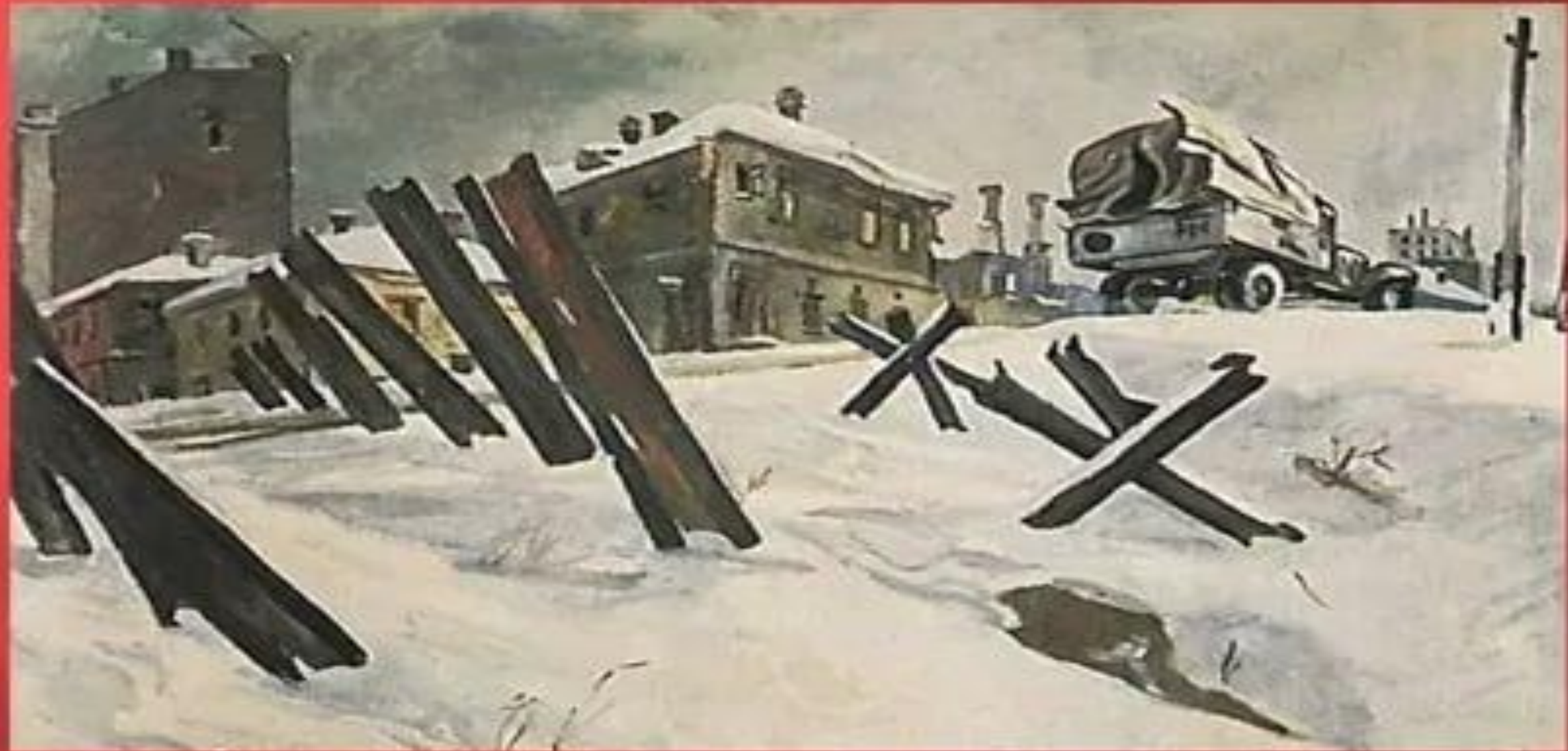
Окраина Москвы. Дейнека А.А. ноябрь 1941 года