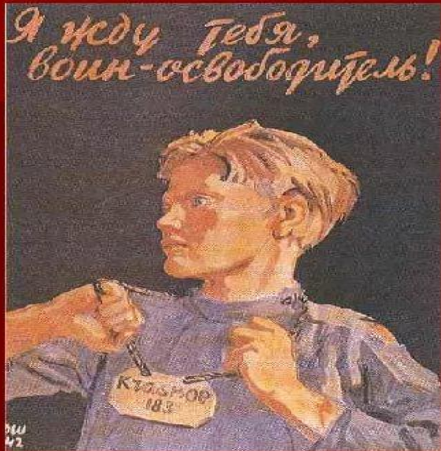
Д. Шмаринов. 1942