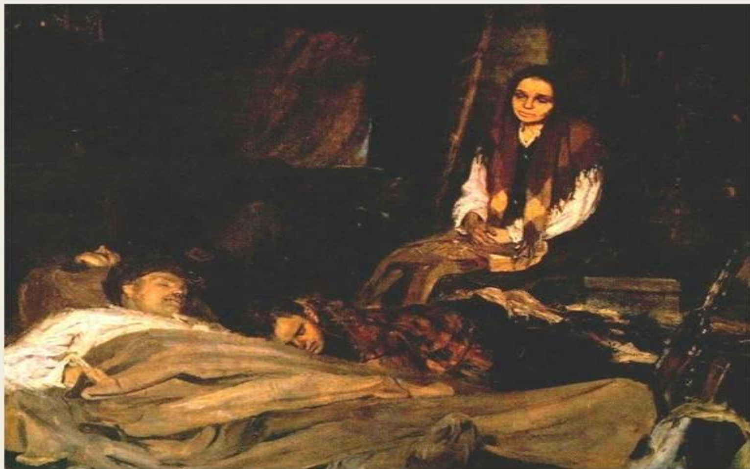
Б. М. Неменский в картине «Мать» (1945).