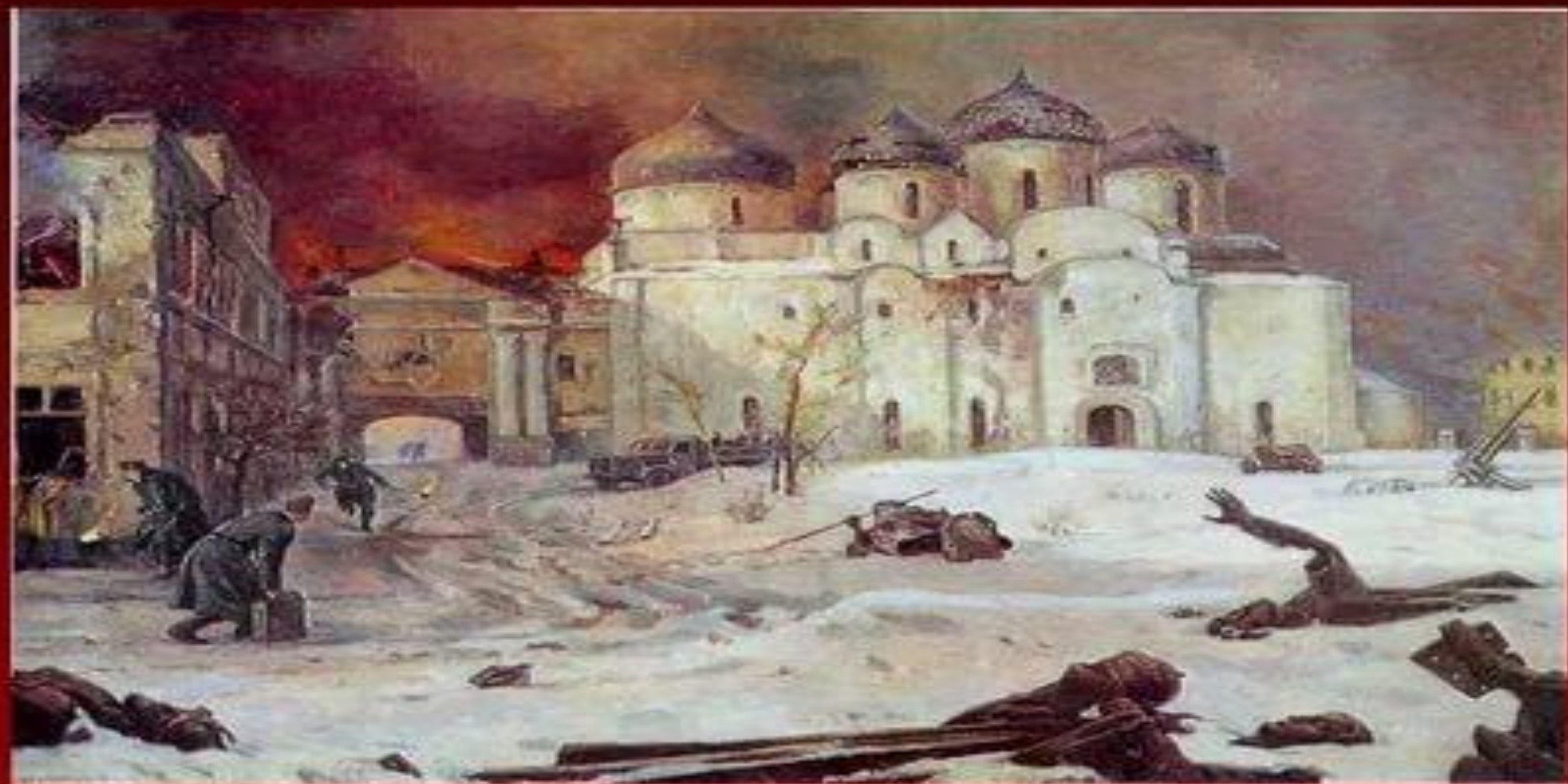
КУЗЬНИКОВЫ «БЕГСТВО ФАШИСТОВ ИЗ НОВГОРОДА»