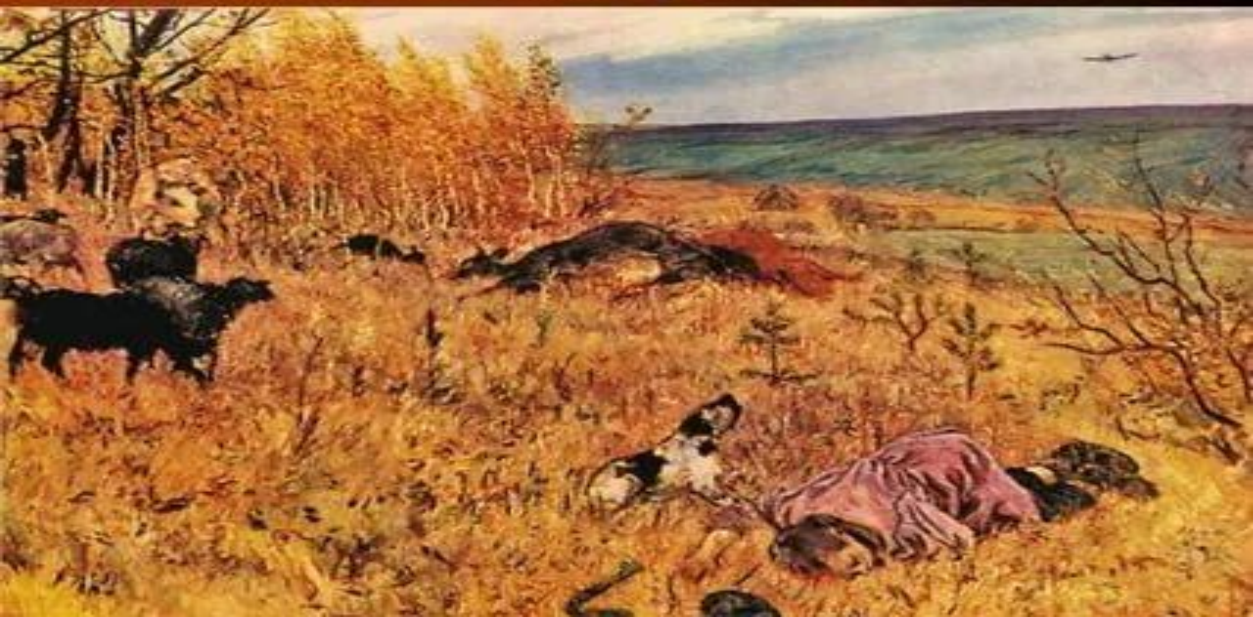
А. Пластов. «Фашист пролетел», 1942 г.