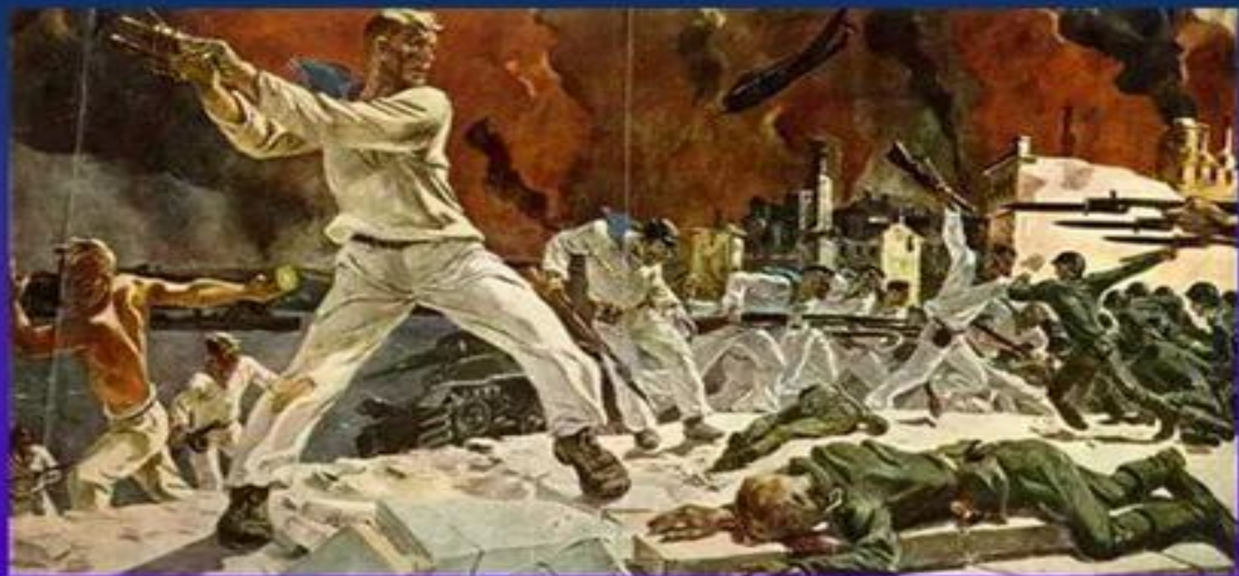
Дейнека «Оборона Севастополя»