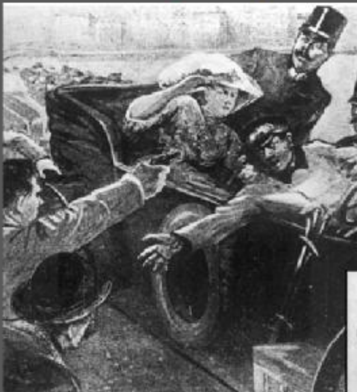
Убийство эрцгерцога Франца-Фердинанда в Сараево

Начало военного конфликта было связано убийством наследника Австро - Венгрского престола, эрцгерцога Франца Фердинанда в Сараево.