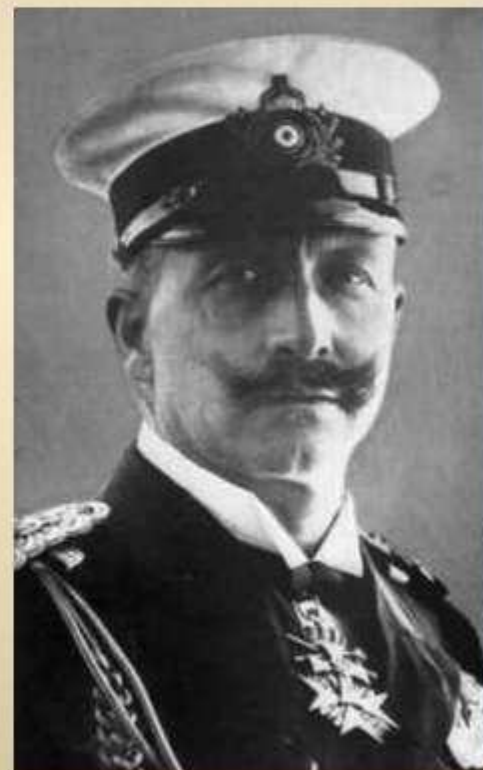
Император Вильгельм II