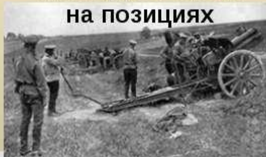
Русские артиллеристы в Галиции