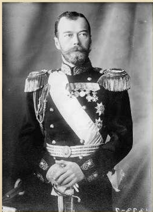
Император Николай II

1 августа (19 июля по ст. ст.) Германия объявила войну России