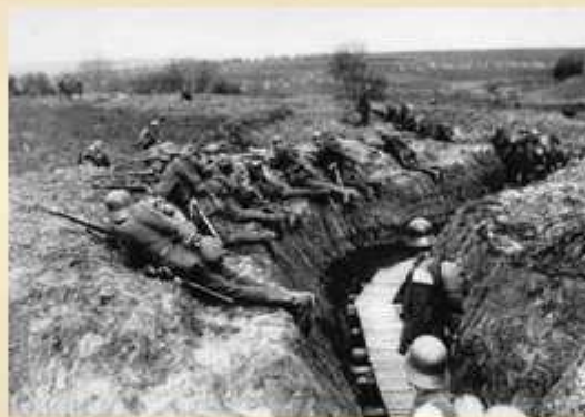
Немецкие войска на позициях