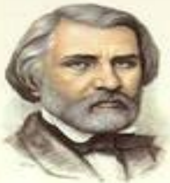
ТУРГЕНЕВ Иван Сергеевич 28 октября (9 ноября) 1818 г.

Берегите наш язык, Наш прекрасный русский язык!