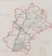
Схема боевых действий на территории Чудовского района