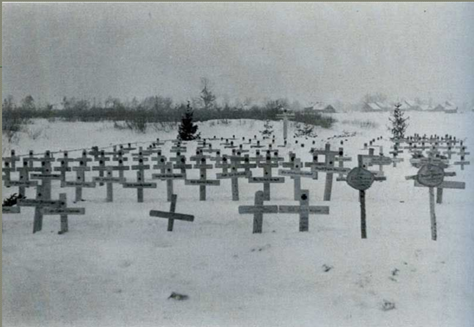
großer Friedhof bei Tschudowo im Febr. 1942 54

Большое кладбище под Чудовым, в феврале 1942 г.