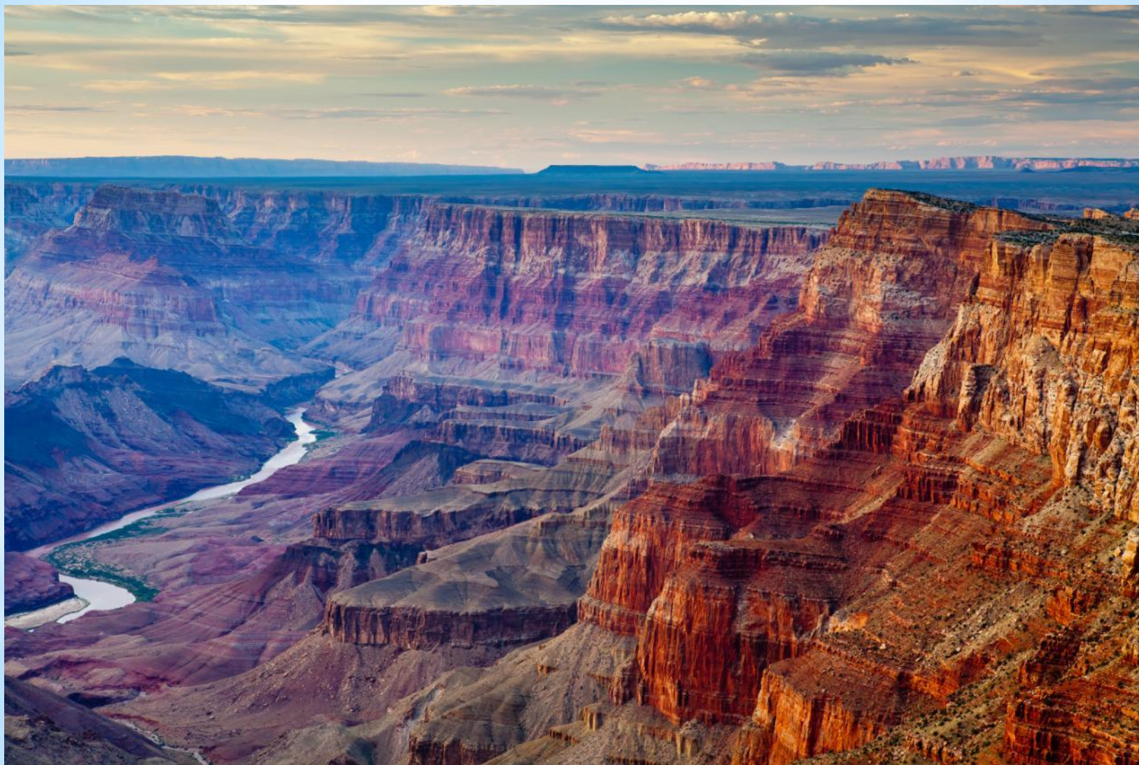
Большой каньон Колорадо