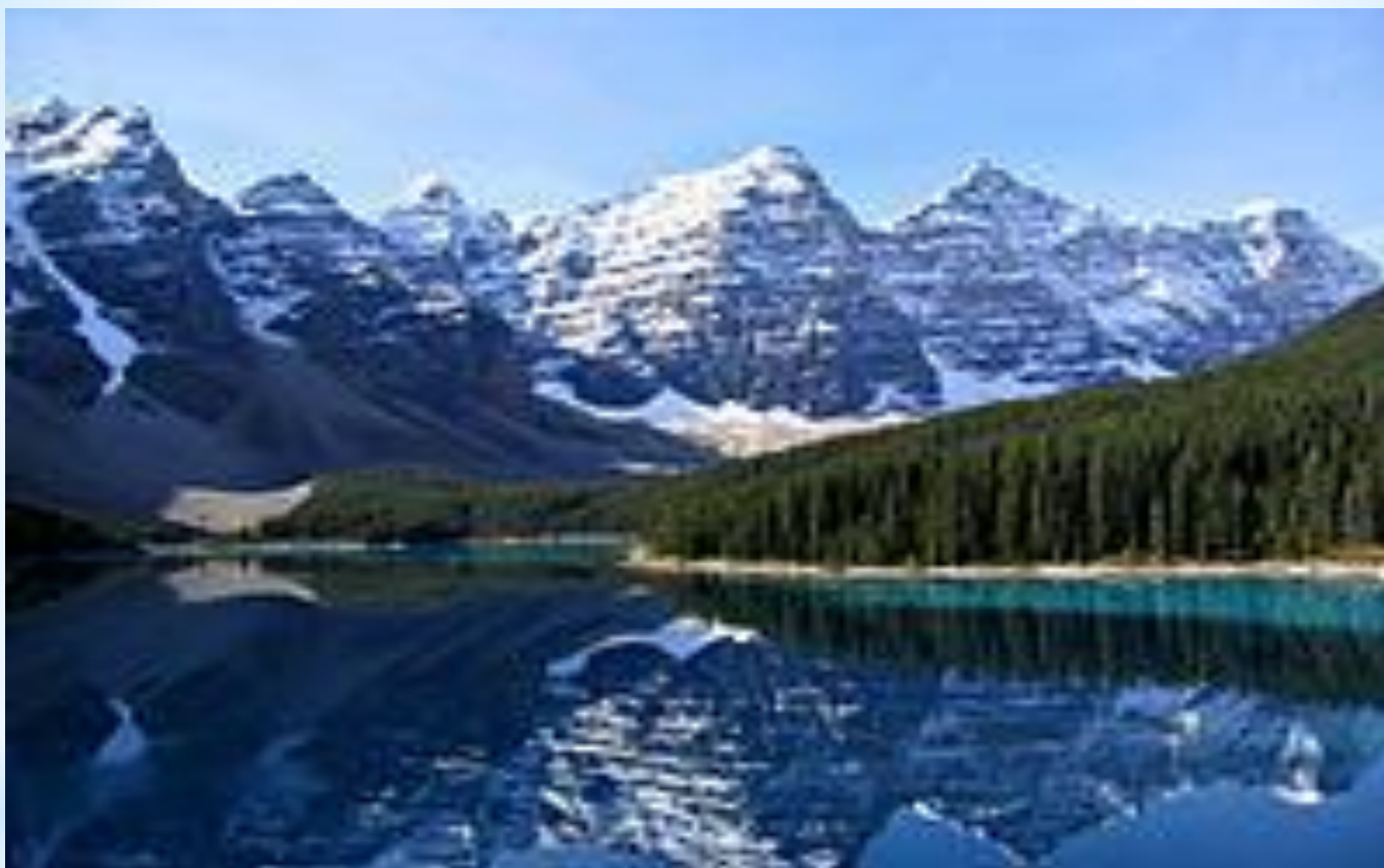
Национальный парк Банф