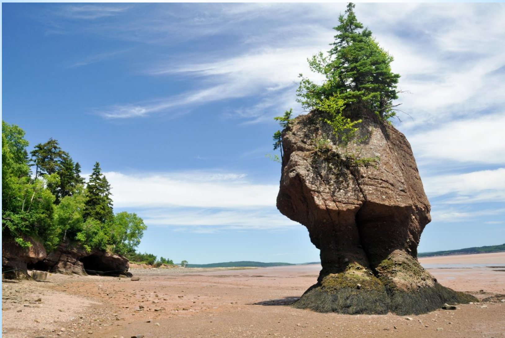
Отлив в заливе Фанди