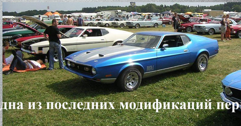
Одна из последних модификаций первого поколения.