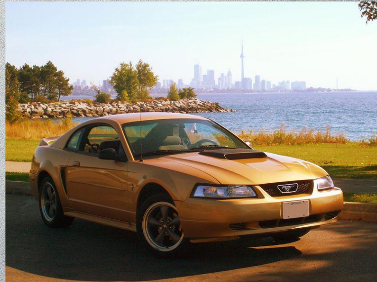
Mustang в стиле New Edge.