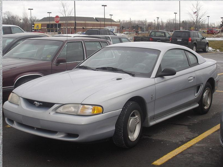
Мустанг 1994 года с «округлым» кузовом