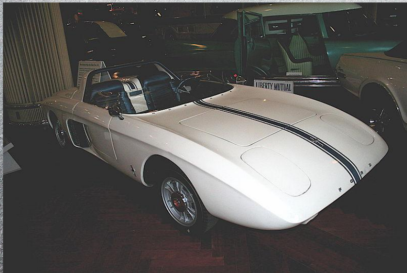
Первоначальный концепт Mustang I с V4 в 40 л.с. 1962 год.