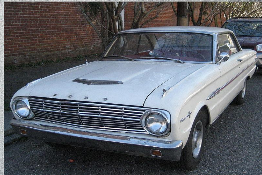
Ford Falcon Sprint — концептуальный предок оригинального Мустанга и донор многих узлов и агрегатов.