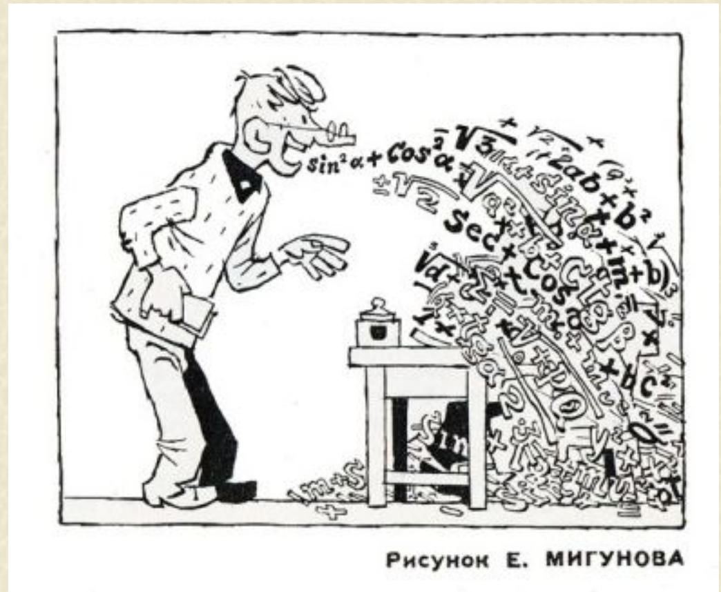
Рисунок Е. МИГУНОВА