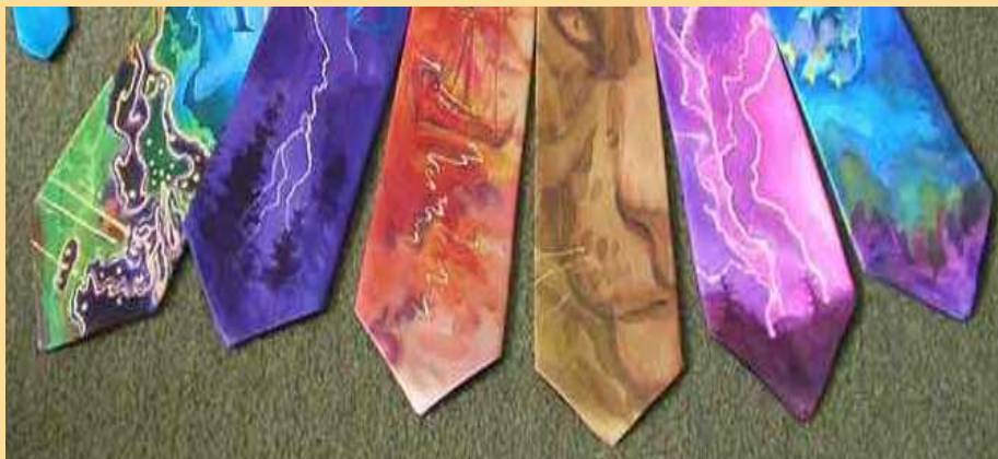
фотофильм печать и др.