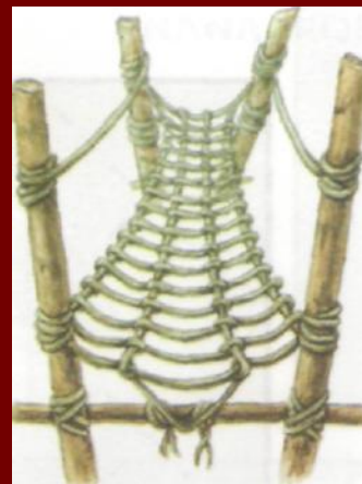
МОСТ ИЗ ЛИАН