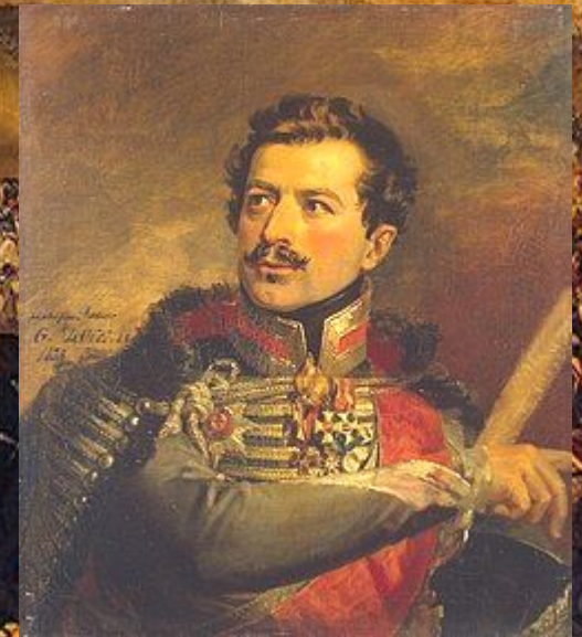
Портрет Александра Никитича Сеславина работы Джорджа Доу