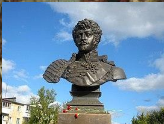
Памятник А.Н. Сеславиному во Ржеве