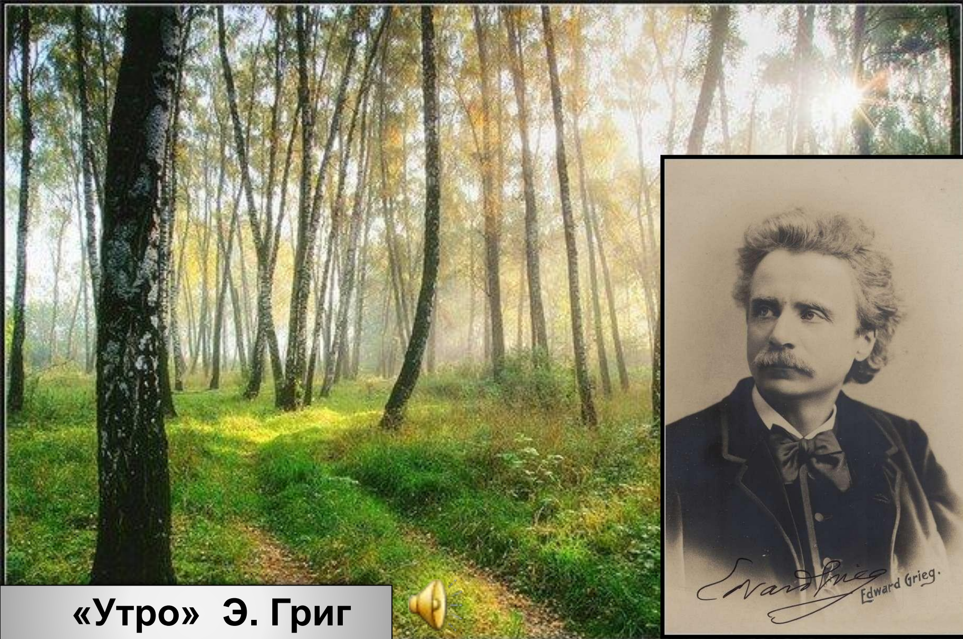
«Утро» Э. Григ