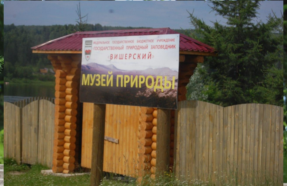
Посещение музея природы