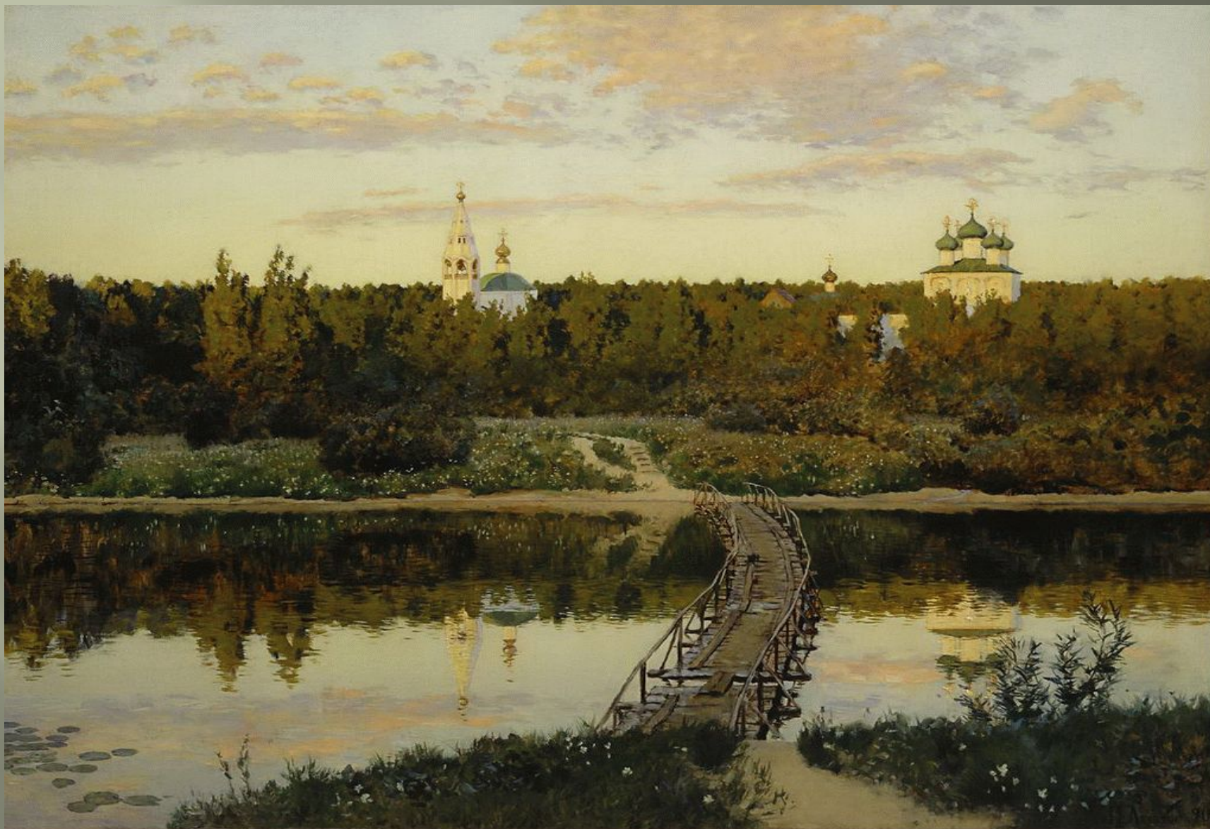
И.И.Левитан. "Тихая обитель". 1890 г. Гос. Третьяковская галерея