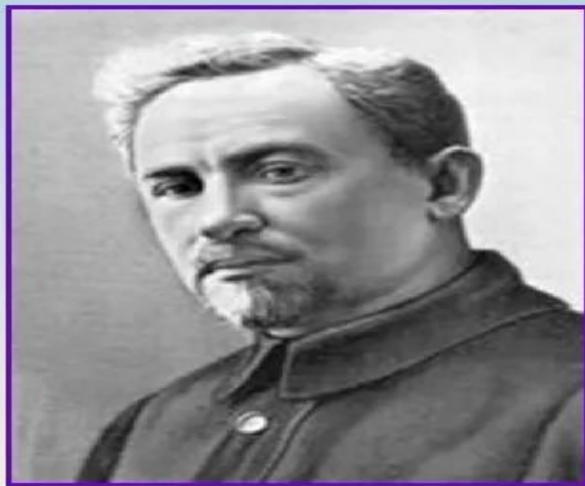
ПЕРВЫЙ СЕКРЕТАРЬ КРОЙКОМА ПАРТИИ В 1925-1933 ГГ.