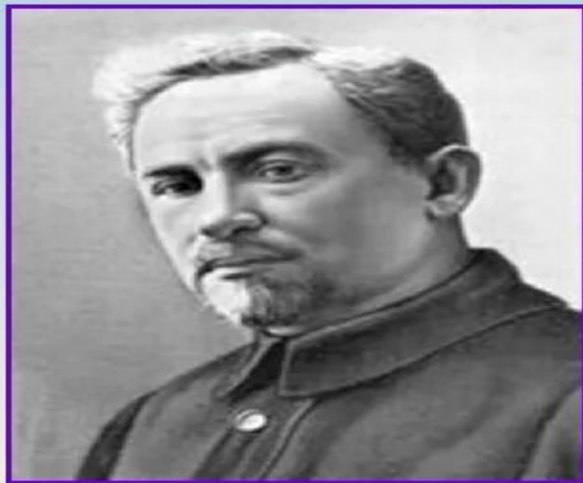
ПЕРВЫЙ СЕКРЕТАРЬ КРОЙКОМА ПАРТИИ В 1925-1933 ГГ.