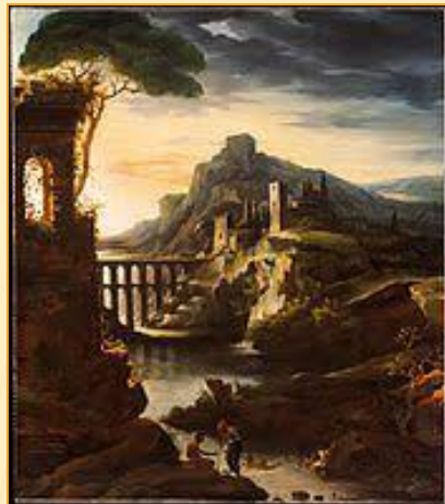
Теодор Жерико Вечер: Пейзаж с акведуком