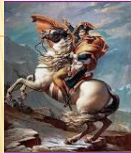
Ж.-Л.Давид, «Бонапарт на перевалі Сен-Бернар»