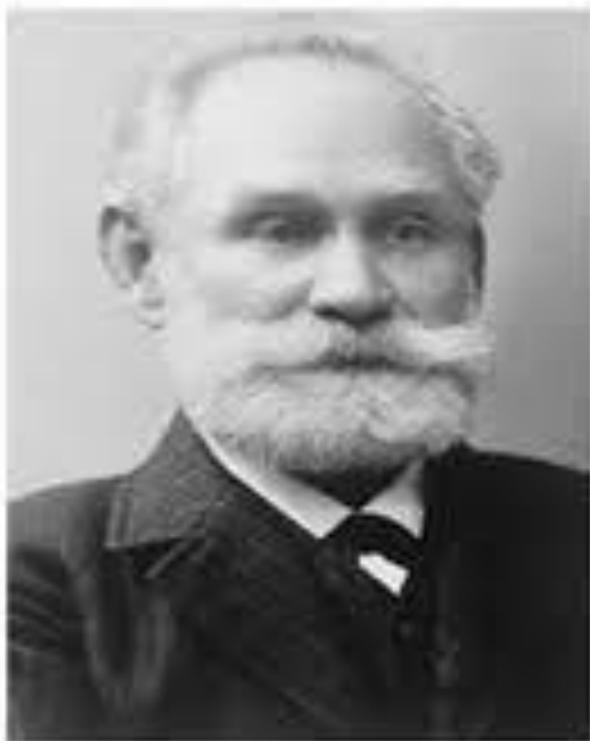
Павлов Иван Петрович (26 сентября 1849г - 27 февраля 1936г)