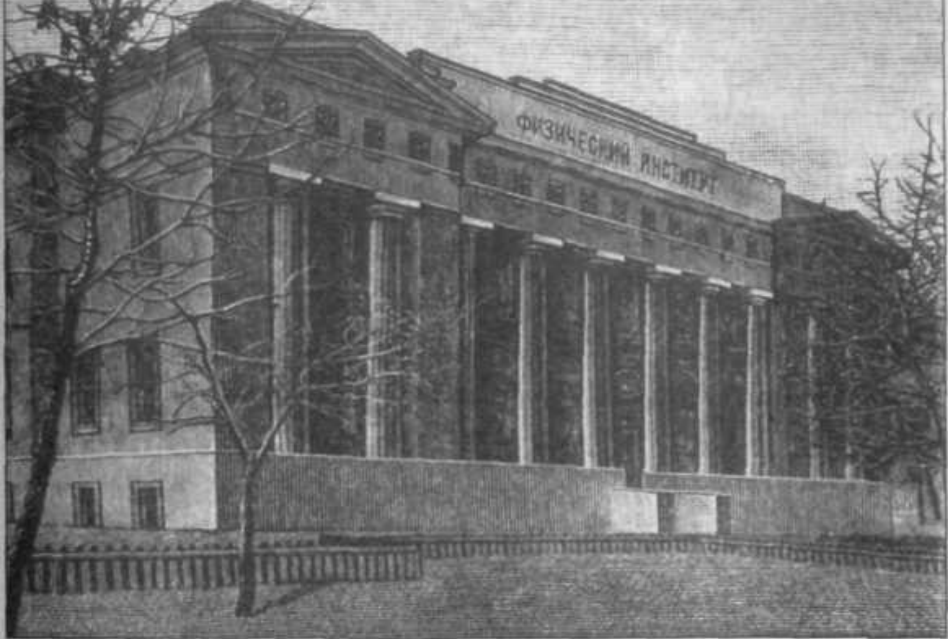
Физический институт Академии наук СССР им. П. Н. Лебедева.