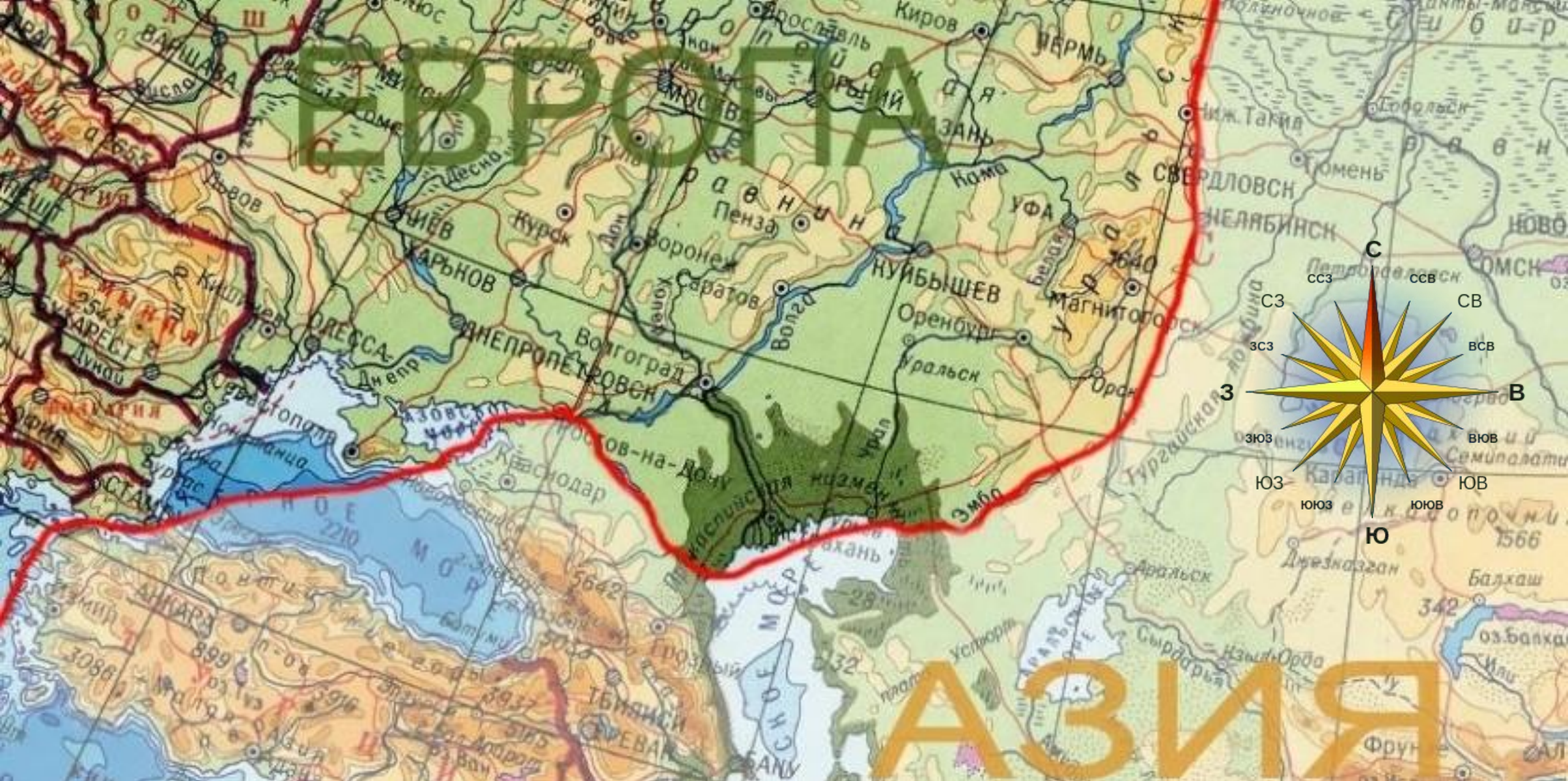
Граница Европы и Азии + стр. 108 учебник