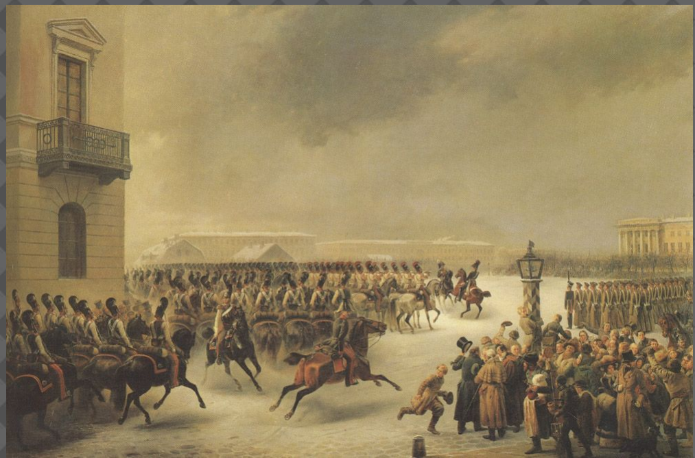
Восстание на сенатской площади