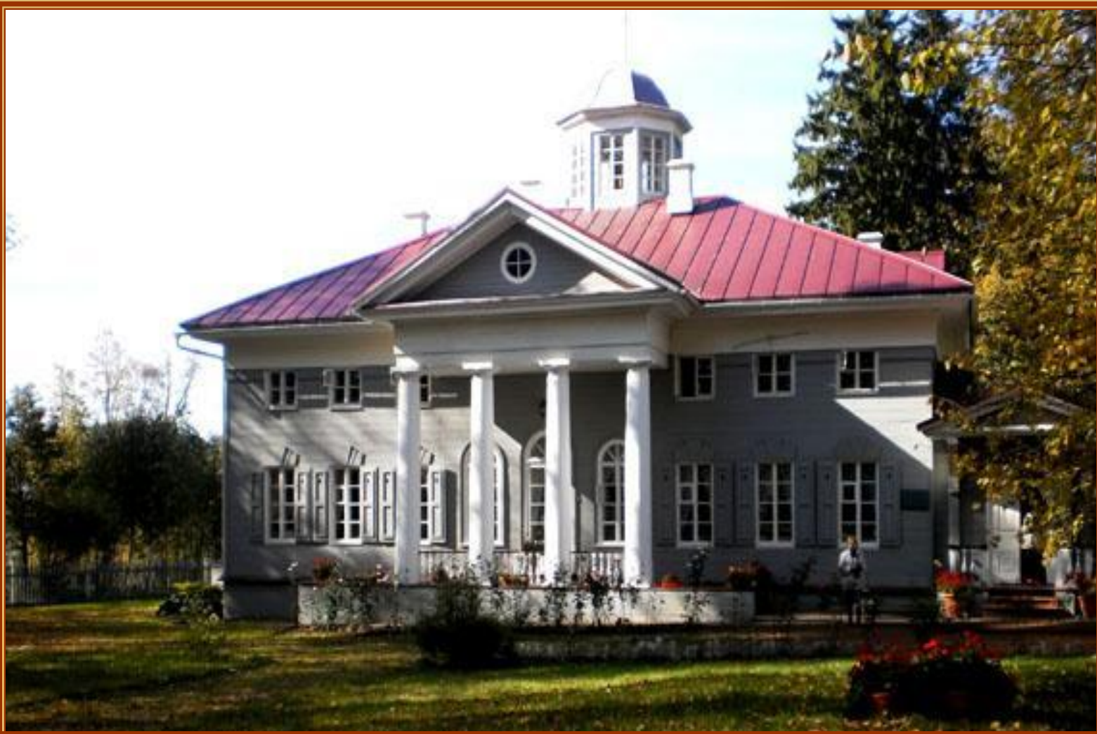
Захарово. Усадьба М.А. Ганнибал