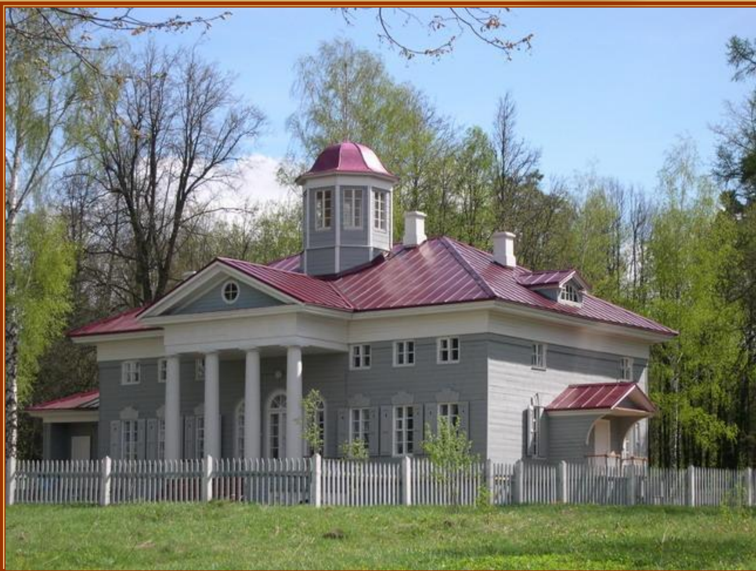
Музей Пушкина в Захарово