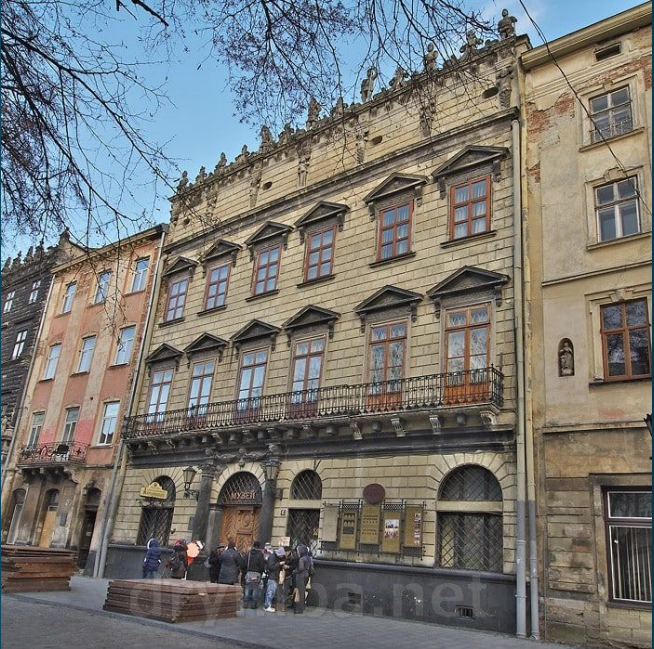
Будинок Корнякта м. Львів