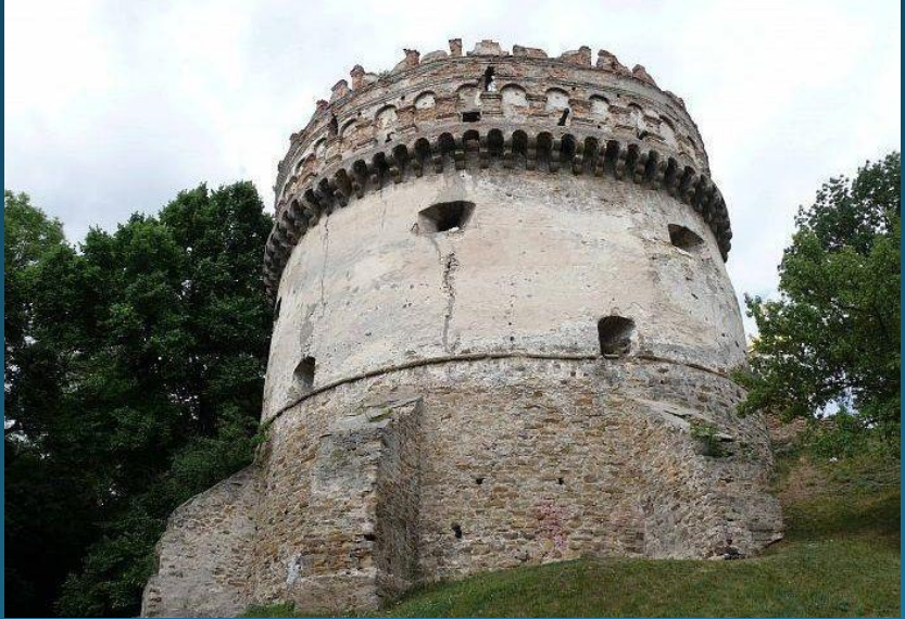
Кругла (Нова) вежа, Острог