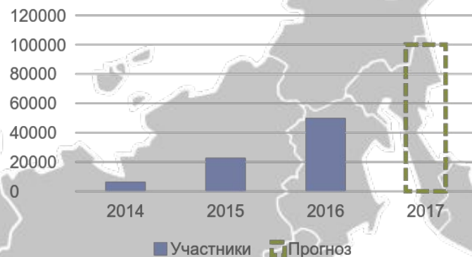
Участников в год