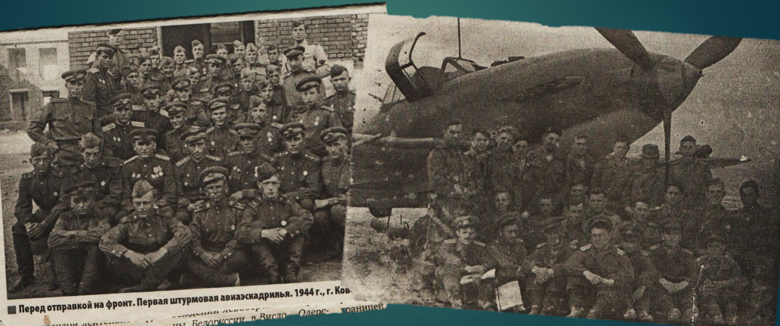
Перед отправкой на фронт. Первая штурмовая авиаэскадрилья. 1944 г., г. Ков...

В ноябре 1944 года поступил в распоряжение 61 гвардейского штурмового авиаполка в 16-ую воздушную армию на 1-ый Белорусский фронт