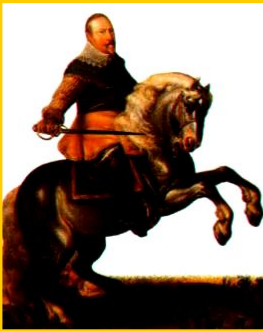
Шведский король Густав II Адольф

Вскоре в Германию вторглись шведы и в ноябре 1632 г. у Лютцена Густав II Адольф разбил католиков, но сам погиб.