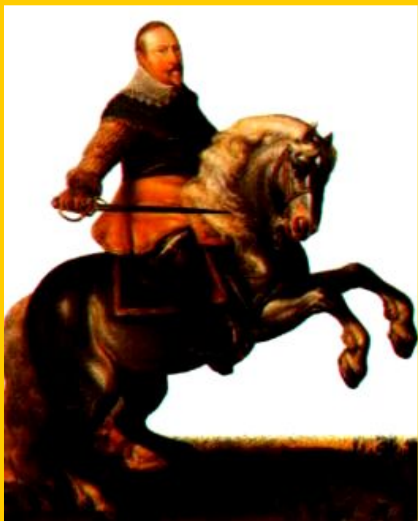
Шведский король Густав II Адольф

Вскоре в Германию вторглись шведы и в ноябре 1632 г. у Лютцена Густав II Адольф разбил католиков, но сам погиб.