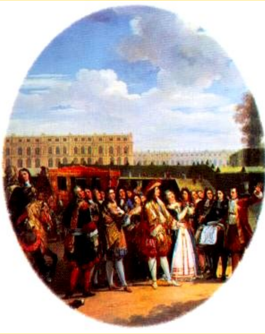
Людовик XIV осматривает Версаль

По окончании войны самыми могущественными государствами стали Швеция и Франция. Французскому королю подражали все европейские монархи. Версаль стал образцом дворцово-паркового зодчества.