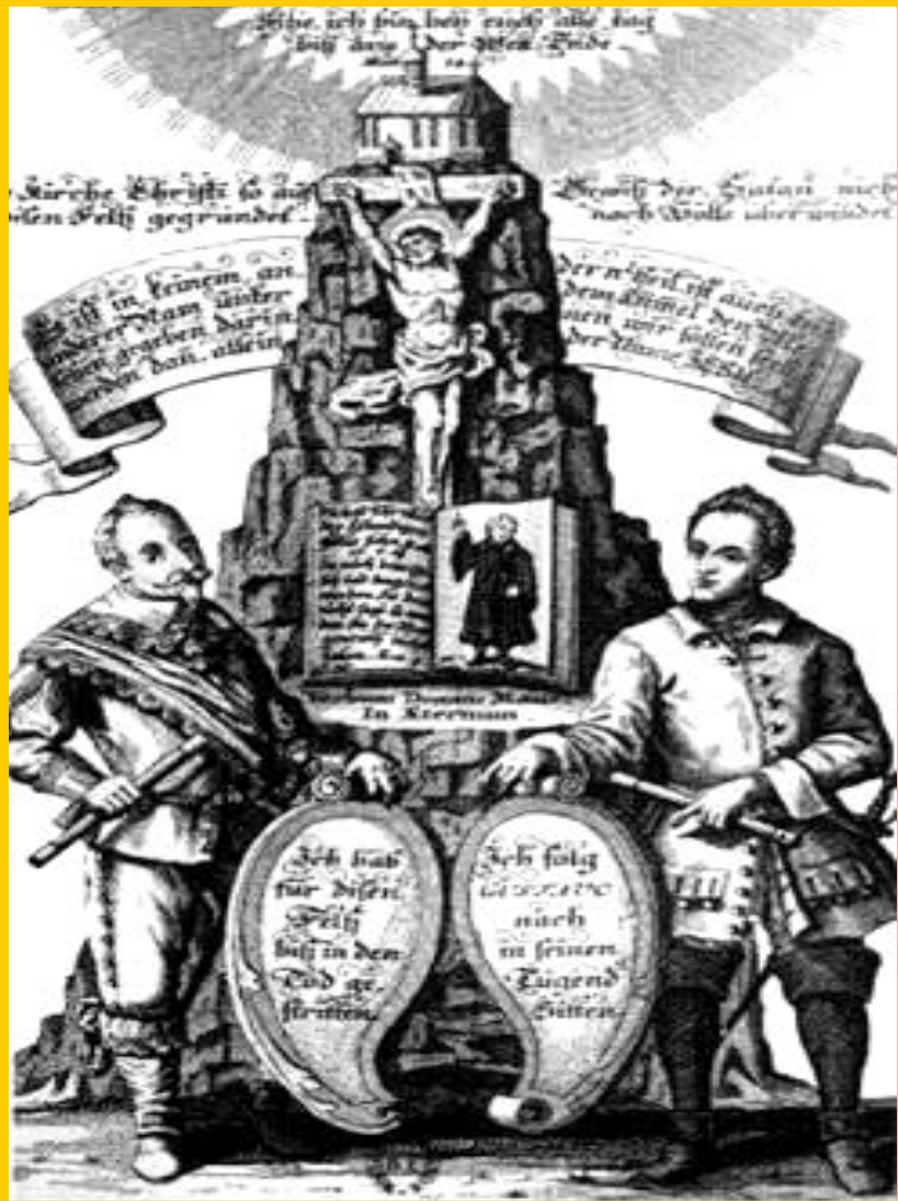
Густав Адольф II и Карл XII. Мощь Швеции.

Поражение в войне означало окончание французской гегемонии в Европе.