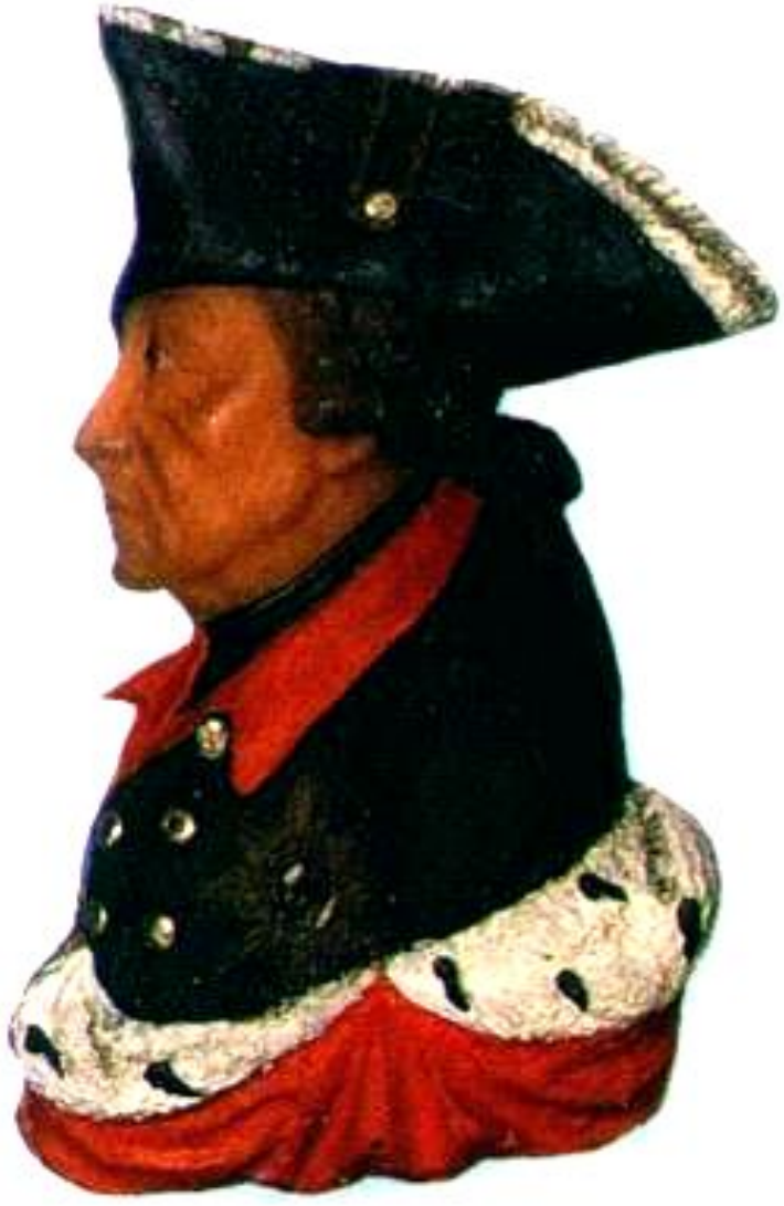
Фридрих II— Король

Международные отношения в 18 в. были очень запутанны и противоречивы. Пруссия, возглавляемая Фридрихом II Великим начала захватнические войны. В ходе борьбы за австрийское наследство Фридрих захватил Силезию и стремился подчинить Саксонию, Чехию, часть Польши. Он полагал что ослабшая Франция не станет мешать.