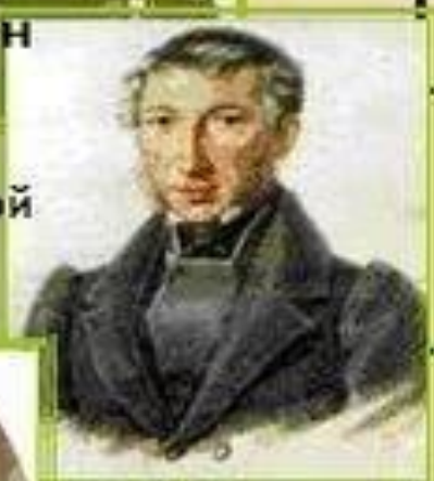
С. П. Трубецкой