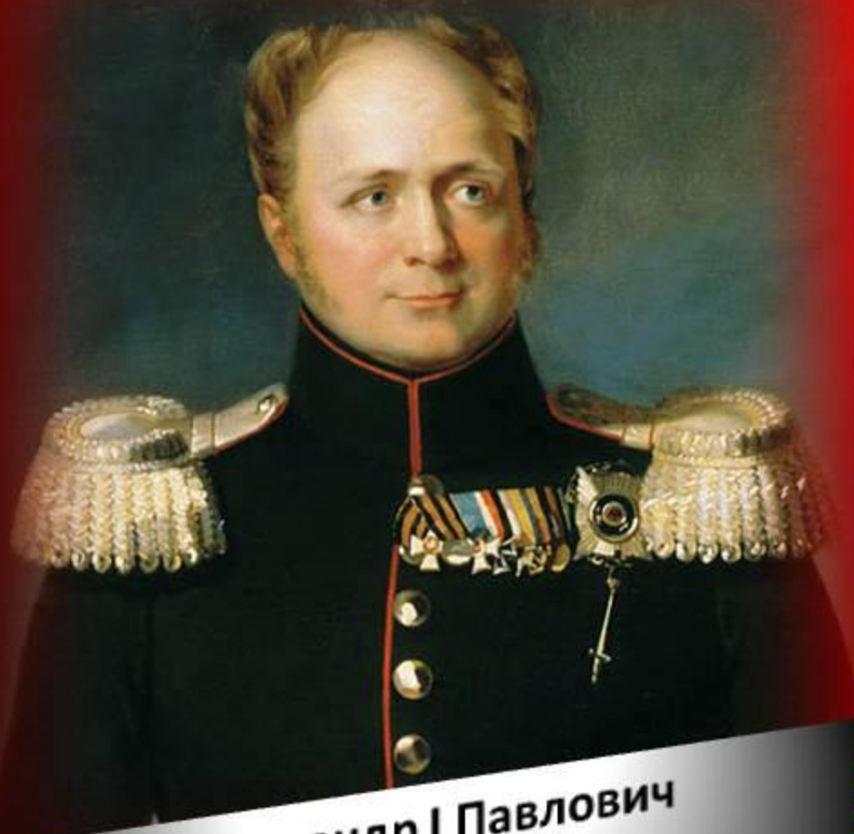
Александр I Павлович Благословенный [1777–1825]