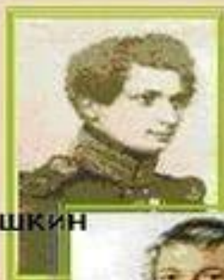
И. Д. Якушкин