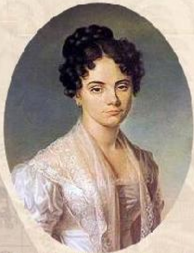
Мария Николаевна Волконская