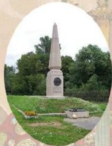
Памятник жёнам декабристов в Тобольске