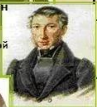
С. П. Трубецкой