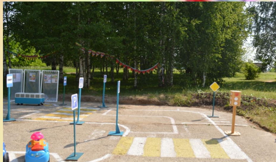
Вид правой части городка