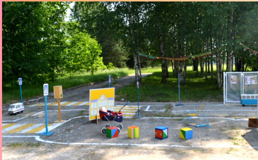
Вид левой части городка