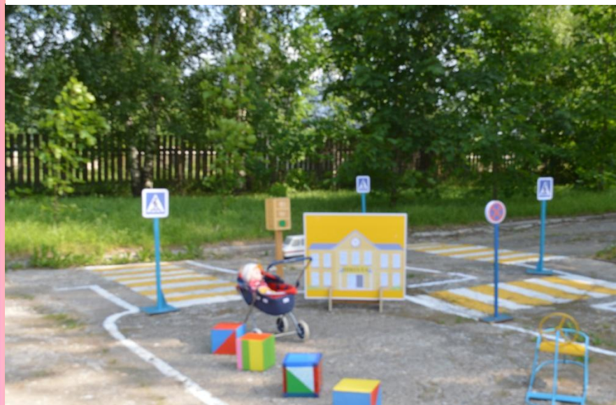
Детская площадка. Школа.