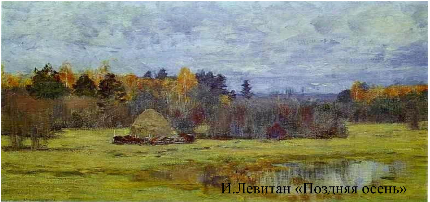
И.Левитан «Поздняя осень»