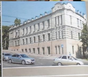
Историческое здание Пензенской областной библиотеки имени М. Ю. Лермонтова