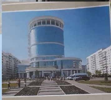
Пензенская областная библиотека имени М. Ю. Лермонтова, г. Пенза