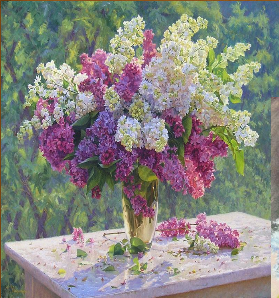
Г.Кириченко «Сирень в саду»