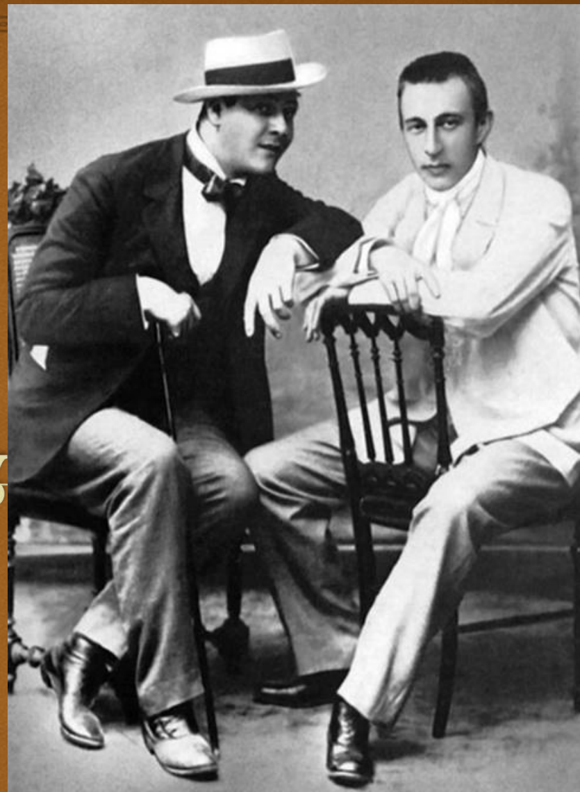
С.В.Рахманинов и Ф. И.Шаляпин