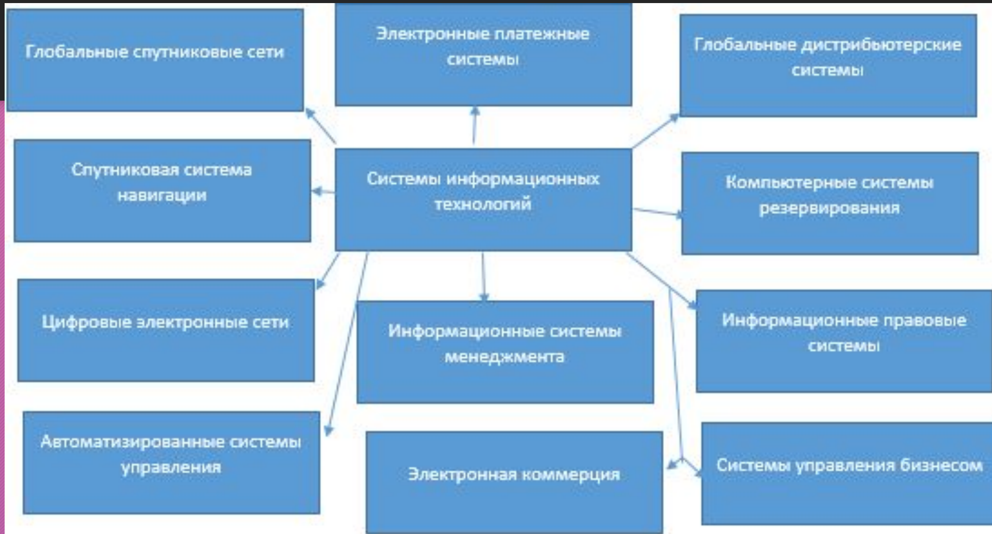
Схема 1 – Основные виды систем ИТ