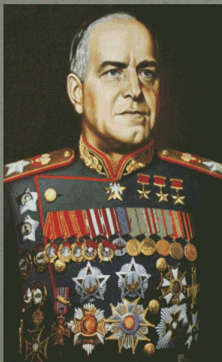
генерал Г.К. Жуков