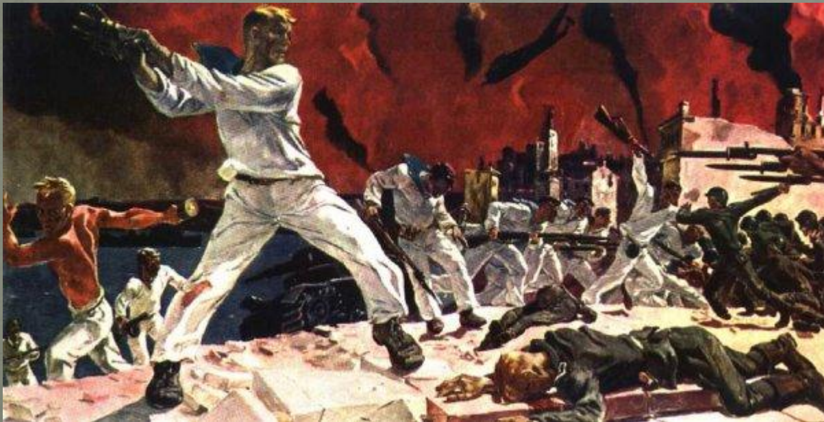
А. Дейнека. «Оборона Севастополя»