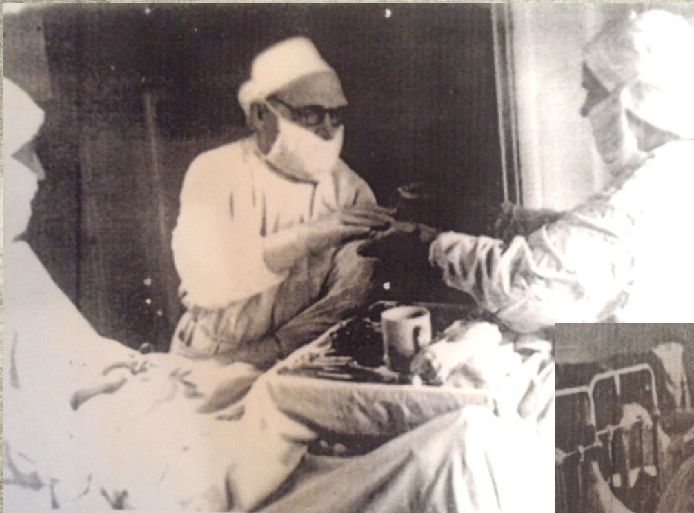
Прифронтной госпиталь, школа №62, 1