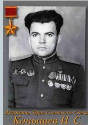
Держинцы Герои Советского Союза Коньшев Н.С.