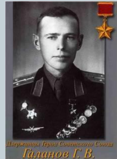
Держинцы Герои Советского Союза Галанов Г.В.