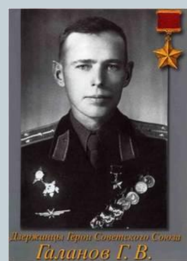
Держинцы Герои Советского Союза Галанов Г.В.