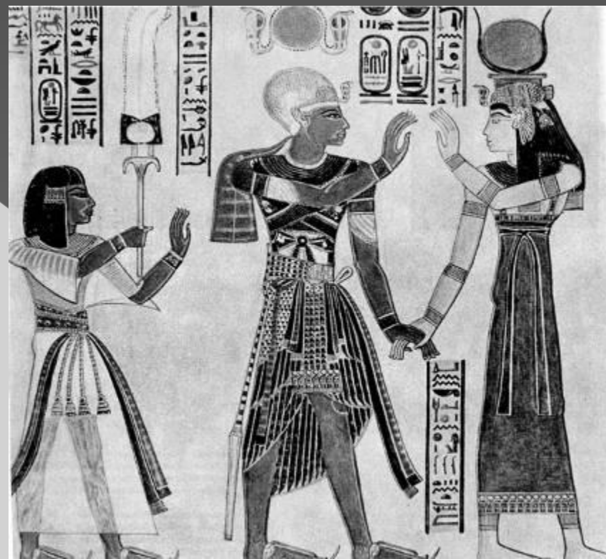
Первый прототип юбки