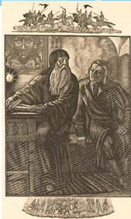
В.А.Фаворский. «Борис Годунов». Фронтиспис к неосуществленному изданию. 1940 г. Бумага, гравюра на дереве.