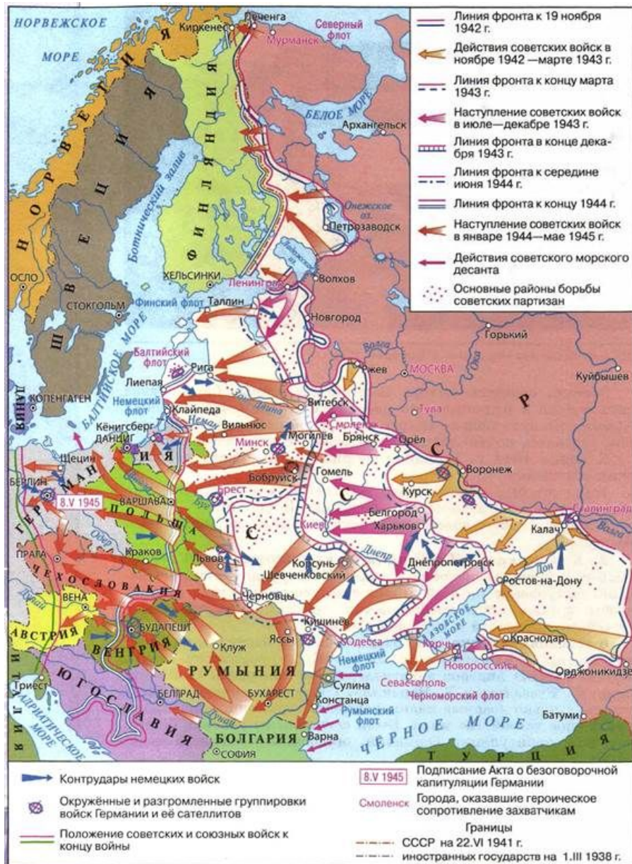
Карта военных действий в ноябре 1942-мае 1945 гг.