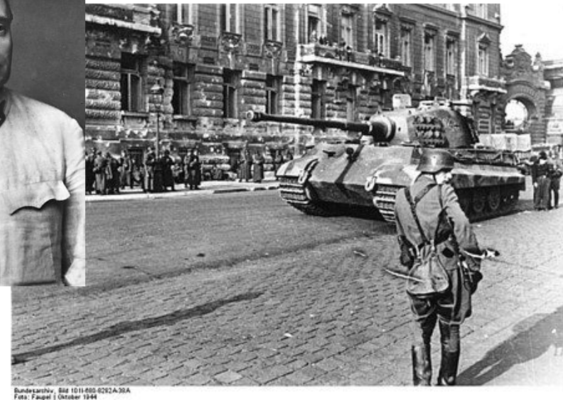
DundesLairNiv. Bild 1011-000-0292A-30A | Oktober 1944