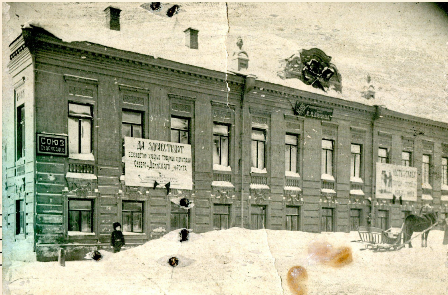
Клуб судоходцев имени В.И. Ленина, [1918-1922 гг.]