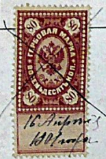
Выпись из метрической книги Шолгской Троицкой церкви Никольского уезда Вологодской епархии за 1890 год о рождении 23 марта 1890 года Шерсковой Антонины Яковлевны. Документ внесен в Государственный реестр уникальных документов Архивного фонда Вологодской области.