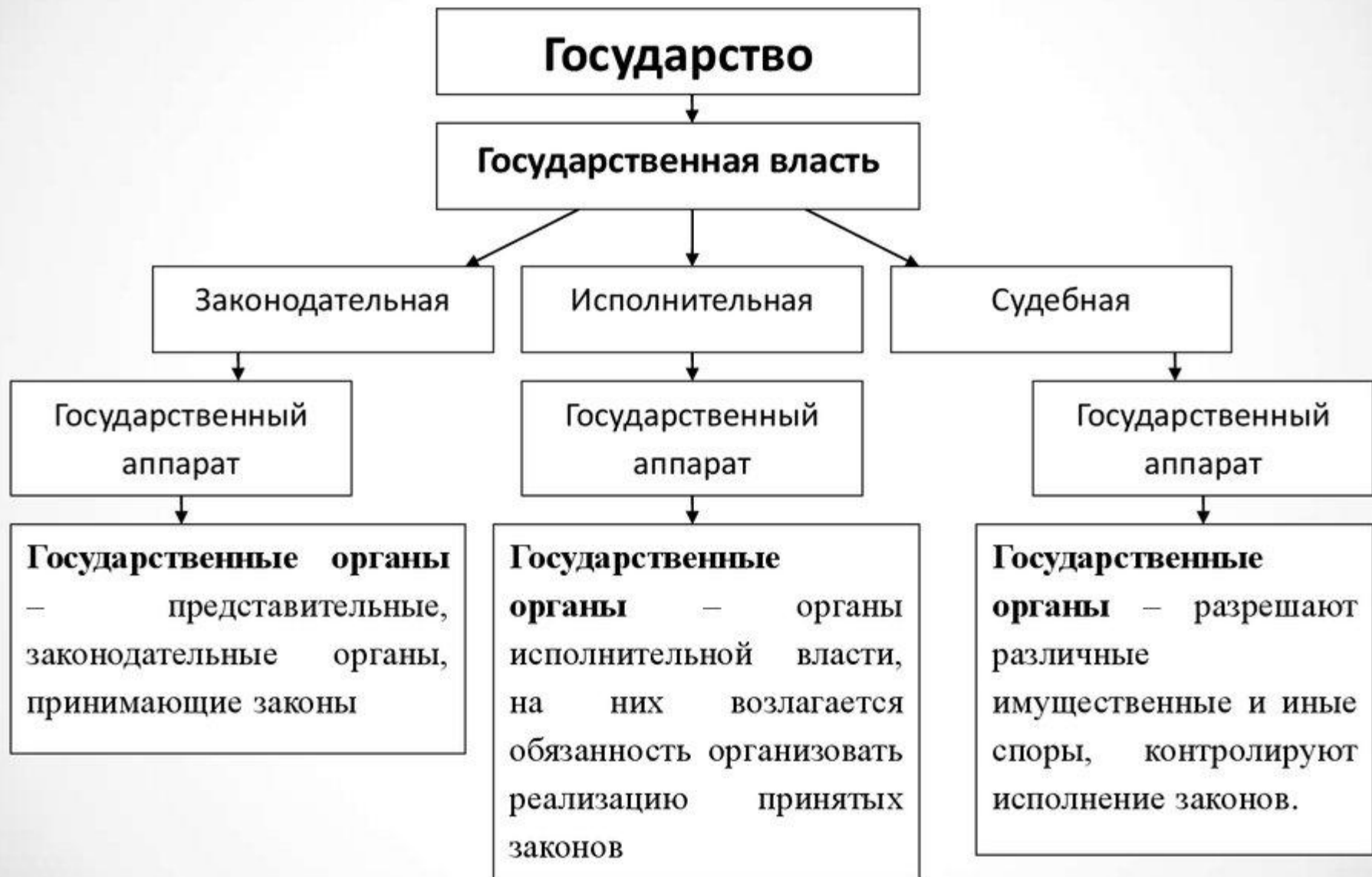
Рис. 3 Соотношение понятий функций государства; функций государственной власти; функций государственных органов